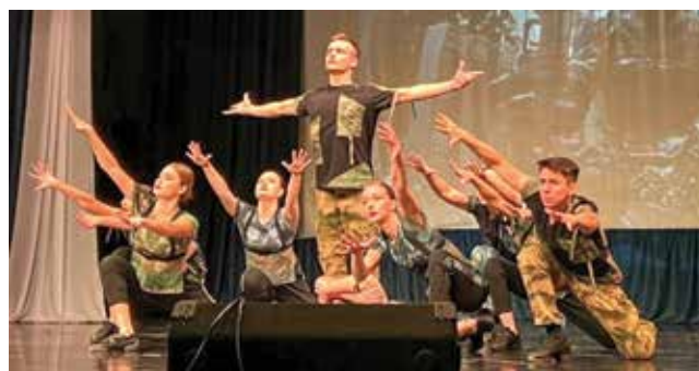
Композиция о доблести, о подвигах, о славе

мент. Он не звучит, с первого раза и не получится, так как необходимо усердие, которого как раз не хватает. Все, инструмент в сторону. У нынешних ребят есть такое: вот я нажму кнопку, и чтобы ничего не делать больше. А там надо напрягаться, работать над звуком, интонацией. Чтобы этюд сыграть, нужно один пассаж десять раз повторить на той же флейте, а это же неинтересно.