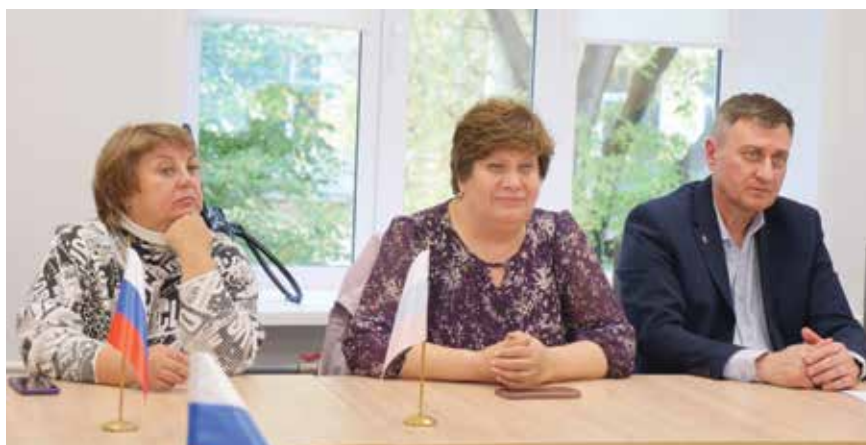
Презентация итогов первого этапа инклюзивной аудиолaborатории «Невидимое кино»

Такое оборудование многие встретили впервые. В руки участников аудиолaborатории попали и затем использовались по назначению известные во всем мире рекордеры, микрофоны-пушки и петличные микрофоны Saramonic, знаменитые студийные микрофоны — старейших в России предприятий «Октава» и «Союз», уникальные инновационные акустические системы резидента Сколково компании «Тэфра Аудио», приборы обработки из Санкт-Петербурга Shift Line. Благодаря этой технической поддержке, для «фильма без картинки» ребята смогли записать различные звуки, шумы, диалоги и музыку — в помещении и на