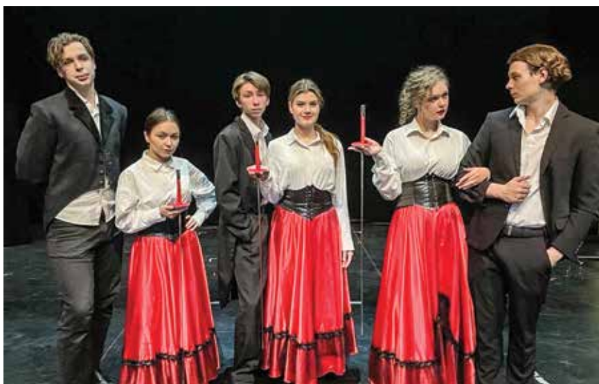
Выпуск 2024 года

ной звезде». Несмотря на отсутствие текста и на то, что роль совсем небольшая, на премьере очень волновалась, казалось, что все взгляды зрителей в зале прикованы именно к тебе... С появлением более серьезной роли — Настеньки в спектакле «Село Степанчиково», волнение только усилилось: такая ответственность! Было страшно подвести коллег по сцене, по-