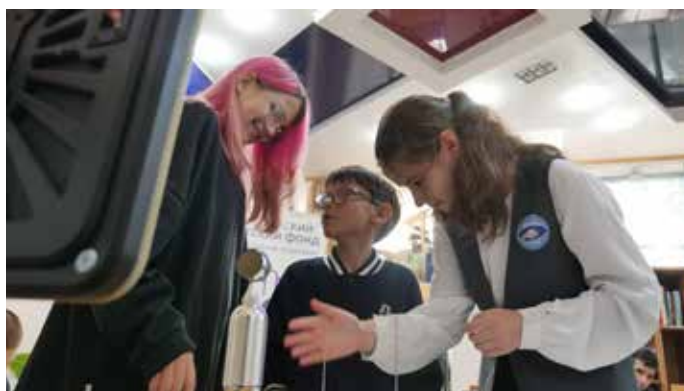
«Терменвокс» — первый в мире синтезатор, на котором можно играть, не прикасаясь к инструменту (изобретен в России)