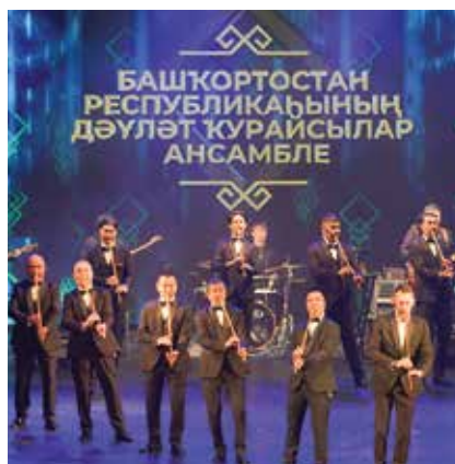
Государственный ансамбль кураистов из Башкортостана

Как всегда, порадовал зрителей своим выступлением народный артист Российской Федерации Иван Пермяков. От души рукоплескали ансамблю русской песни «Раздолье». Как и самым юным участникам программы — коллективу студии народного танца «Спутник» и образцовому коллективу детского центра народного искусства «Озорное колесо». Они завершали концерт, который проходил под девизом «Единство народов — в танце, музыке и песне».