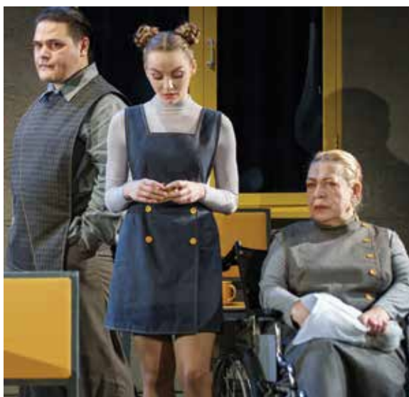
В роли Кабановой в спектакле «Гроза»