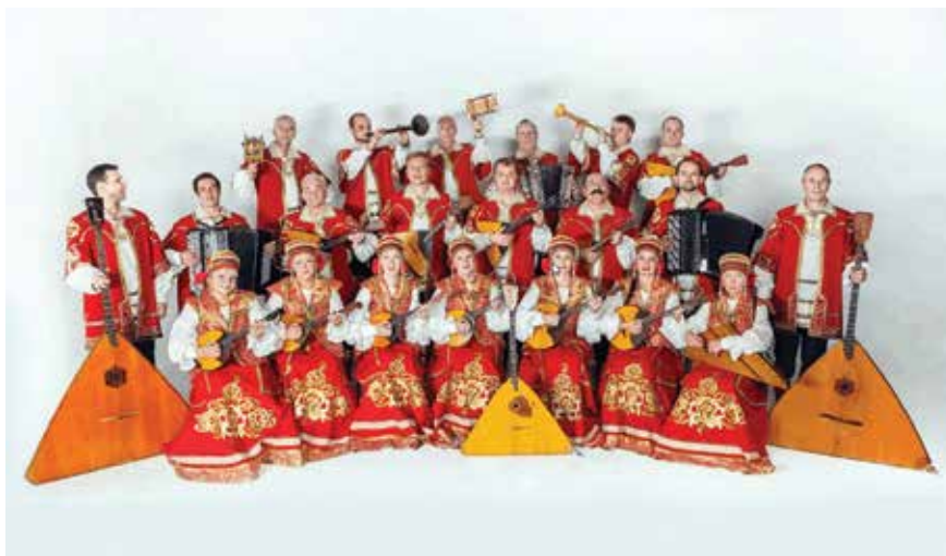
Оркестр русских народных инструментов Пермской краевой филармонии

Еще одним музыкальным подарком стало выступление ансамбля русских народных инструментов «Русичи» из Березовского. А завершилось грандиозное событие не менее феерично, чем началось, — шикарную