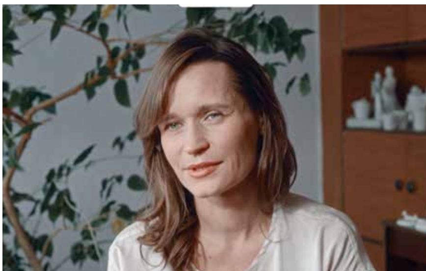
Кадр из фильма Максима Аньшина «Хрупкое»

От привычного производственного фильма с критическим посылом остались кадры с ржавыми дверями, протекающим потолком. Один из героев, рабочий,