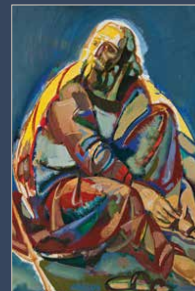
«Снимающий сандалии». 2012

С 27 сентября по 30 ноября Екатеринбургский музей изобразительных искусств совместно с Российской академией художеств провел персональную ретроспективную выставку произведений первого вице-президента Российской академии художеств, народного художника РФ Виктора Калинина. Экспозиция включила около 60 масштабных живописных произведений, охватывающих разные творческие периоды, жанры и темы, и была дополнена тремя знаковыми картинами конца 1970–80-х годов из собрания ЕМИИ.