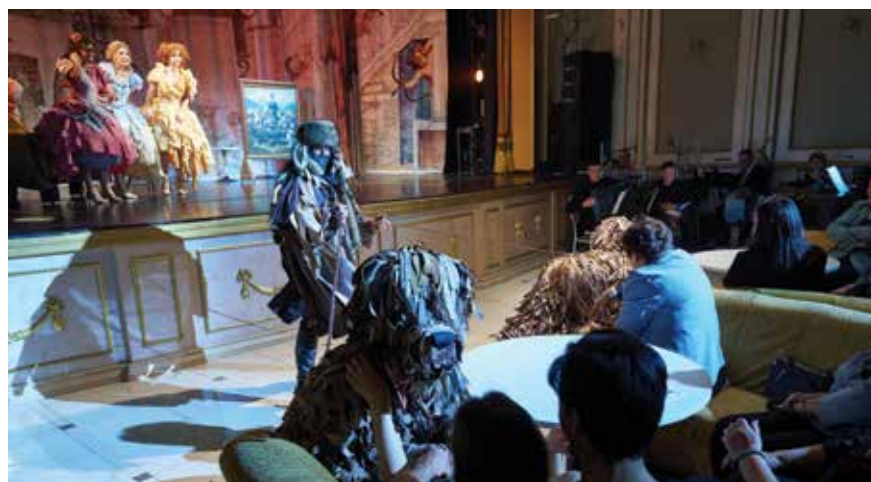
Действие выходит в зрительный зал

нитьбы гусара». Обычно такие действия a la karustnik рождаются сообща. Но безусловный «авторский знак» режиссера Игоря