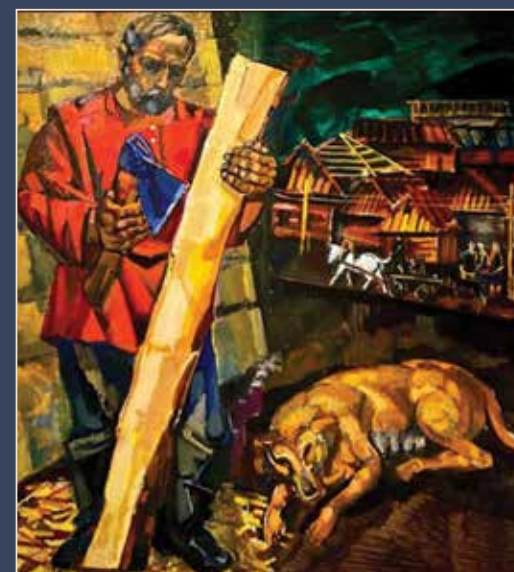
Ранняя работа мастера — «Отец и деревня». 1966