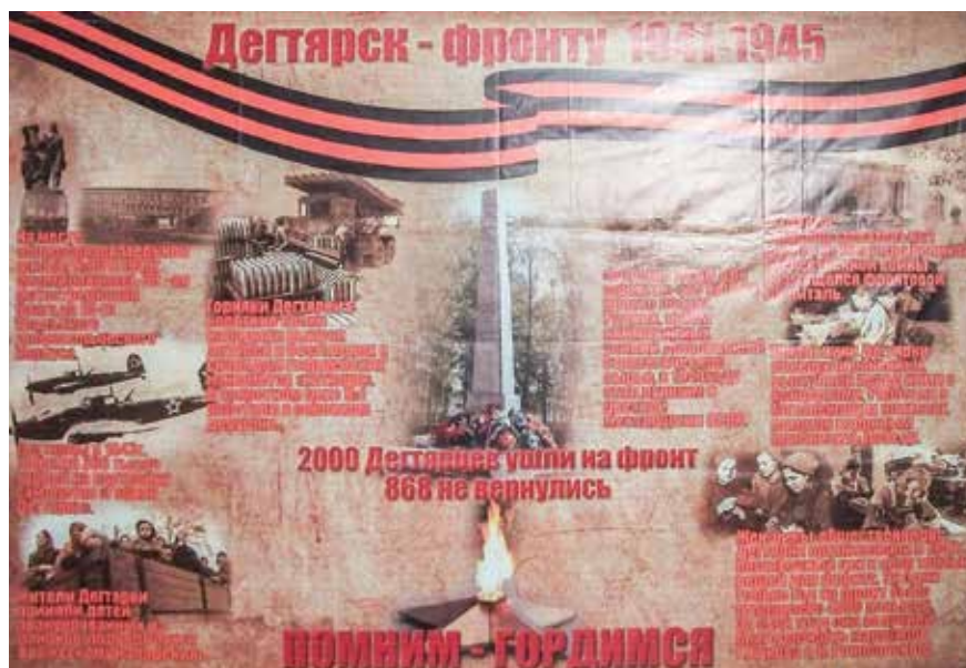
Баннер «Дегтярск-фронту». Часть выездной выставки, посвященной работе города в годы Великой Отечественной войны.

— Здесь собрана вся история рудника, который являлся гордостью Дегтярска. Первые шахты