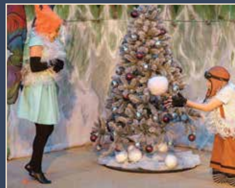
Сцена из спектакля «Комар мечтает о зиме»