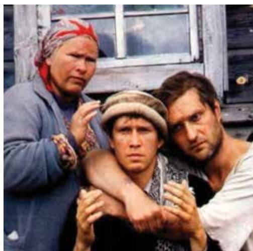
Фильм «Мусульманин» (Нина УСАТОВА, Евгений МИРОНОВ, Александр БАЛУЕВ)

— Я даже не помню, как предмет назывался, по-моему, просто «Театр». Я читала ребятам историю театра, и, чтобы они лучше усвоили программу, мы играли в театр. Разыгрывали куски античной драмы, средневековой драмы, пьес Островского. А началось с того, что мне нужна была дополнительная работа, кроме киностудии.