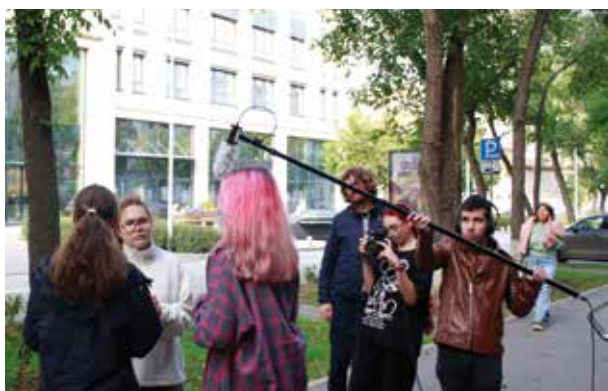
Запись диалогов в звуковом пространстве города с использованием узконаправленных микрофонов