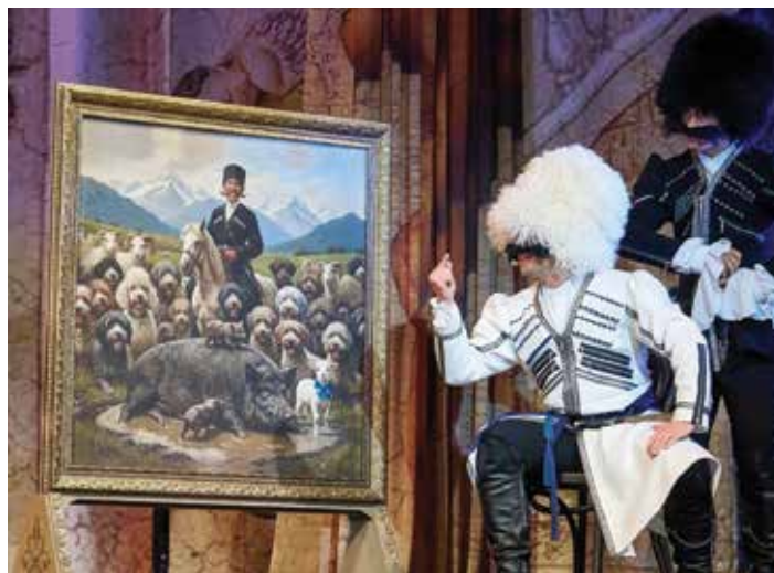
Та самая картина