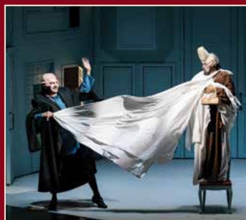
Сцены из спектакля