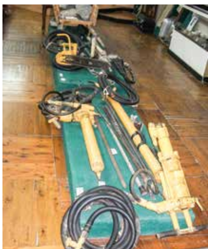
Перфораторы — орудия труда шахтеров Дегтярского рудника — теперь экспонаты музея

руды и направляют в вагонетки. Шахта — это же целое предприятие... Часть этого уже разрушена, к сожалению. Но на тот момент, когда музей создавался, такая панорама была реальностью. Обычно во время экскурсии мы говорим детям: «Закройте глаза! А теперь представьте, какая под землей темнота, да еще и шахтные воды, с содержанием серы. Тяжело было нашим шахтерам работать под землей с переносными масляными светильниками с блендой — специальным козырьком, который позволяет акцентировать световой поток