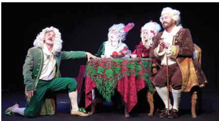
Эскиз «Единственный наследник»