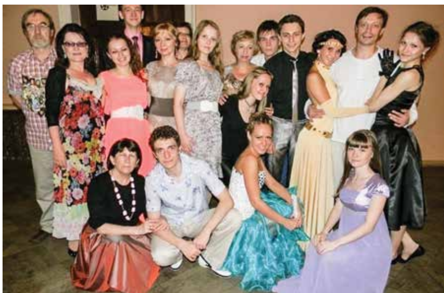
Выпуск 2012 года