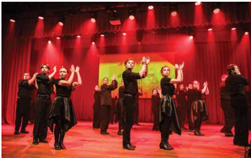
Номер «Испания» соединил несколько поколений выпускников

Сегодня можно смело говорить о существовании ниже-