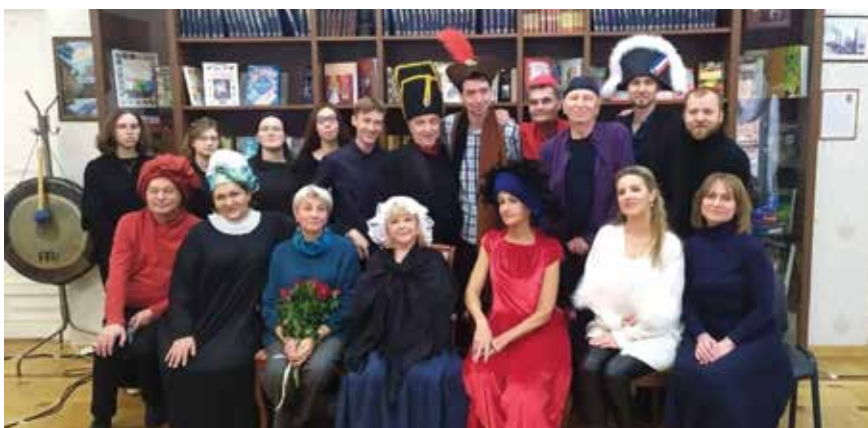
С друзьями — артистами ТЮЗа, певцами, преподавателями консерватории и врачами Областной больницы N 1 в библиотеке имени Герцена

уникальный педагог еще и в том, что не «заточивает» учеников по каким-то своим «лекалам».