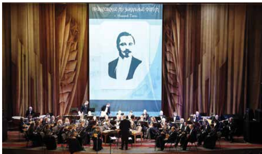
Концерт Приваловского форума