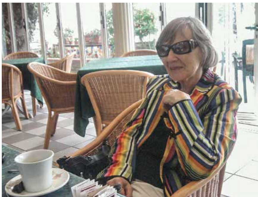
В редком отпуске

— Ну, поскольку я театровед, хожу по театрам. Всегда пытаюсь актеров смотреть. Так увидела Сергея Колтакова в спектакле «Ной и его сыновья» в театре Станиславского. Он мне понравился, и захотелось, чтобы он у нас снимался. Хотя, можно, конечно, и по фильмам. Можно и при встречах, но при встречах есть риск ошибиться. Во-первых, человек может перед тобой не раскрыться. Во-вторых, наоборот, он может быть очень инте-