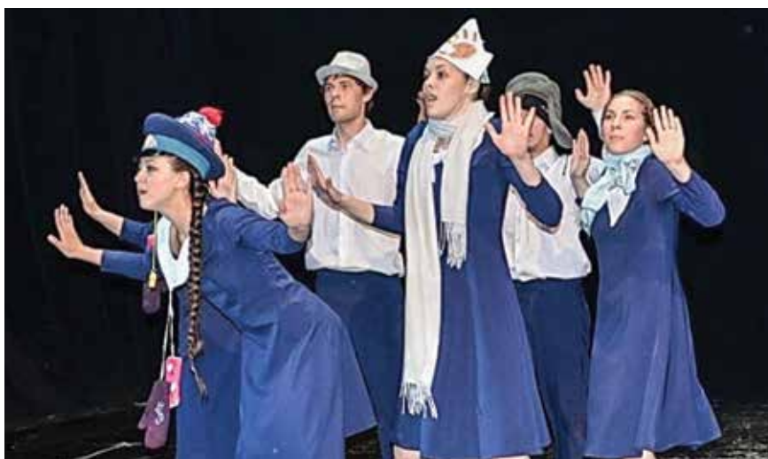
Выпуск 2016 года