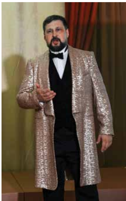
Звучит песня «День Победы»

версия одного из моих исторических проектов (изначально он был показан в камерном варианте в музее-заповеднике Царицыно и екатеринбургском