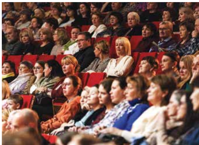
Публика на открытии третьего Приваловского форума