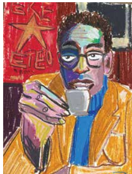
Из серии «Портреты моей души»