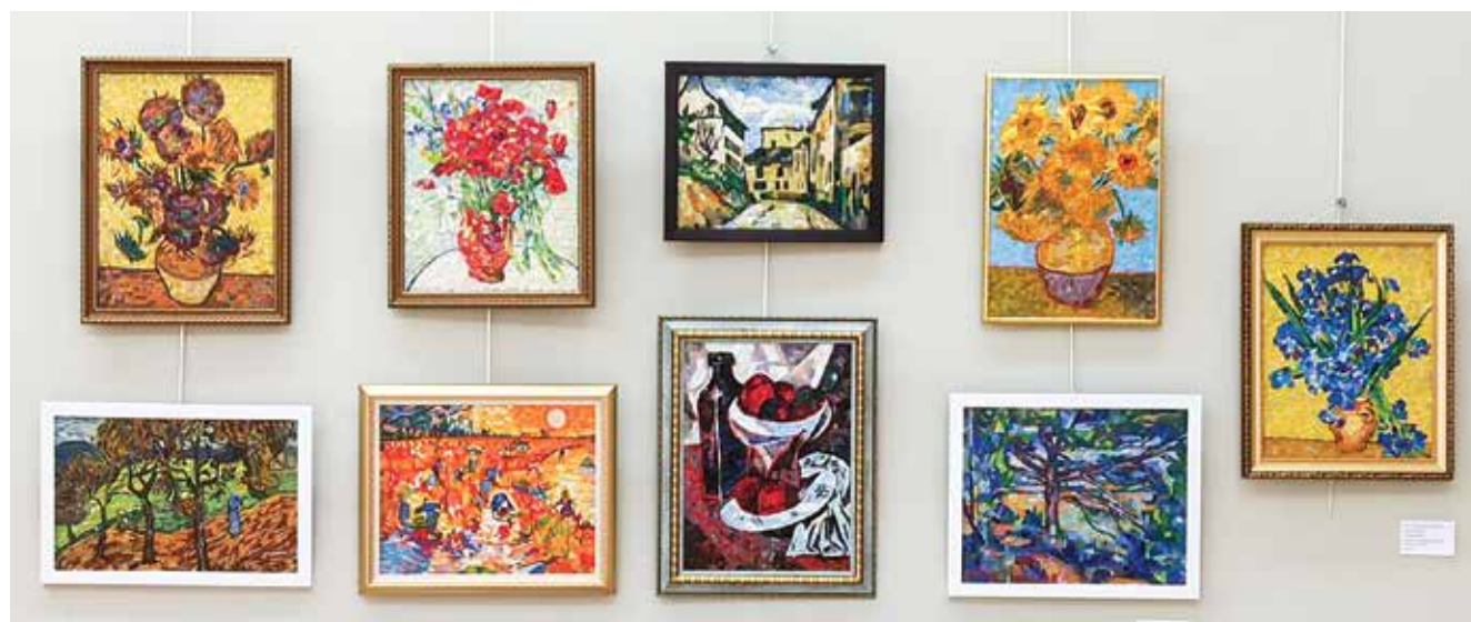
Мозаики Т. Мирошниковой