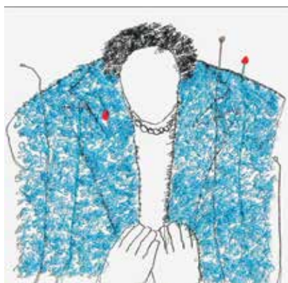
«Зима». Из серии «Переосмысленные»

Изюминкой выставки явились двусторонние портреты, с лицевой стороны которых были даны один женский и мужские образы в узнаваемой авторской трактовке и манере исполнения, но обороты холстов оказались не менее интересны: они представляли собой узелки скрученных нитей, олицетворяя сложный мыслительный процесс каждого из изображенных (Threads of Identity, 2025; Collar, 2025. Из серии «Переосмысленные»). Логично напрашивалась параллель с реальной жизнью, в которой каждый из нас предстает для общества в созданном нами образе, в то время как чувства, эмоции и переживания порой намеренно скрываются. Здесь же художник открыт для диалога со зрителем, обнажая оборотные стороны картин.