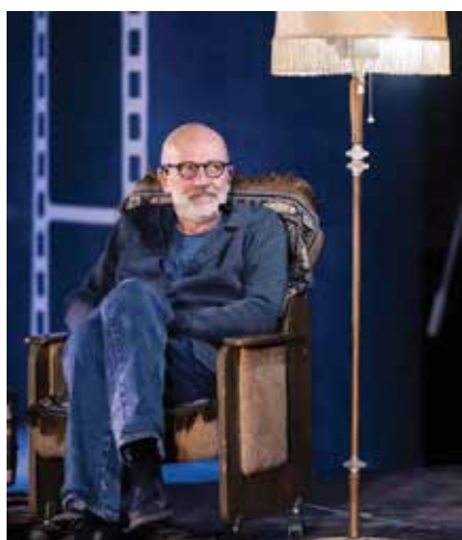
Председатель жюри Александр ГОРДОН

ловская киностудия, ни я, как президент фестиваля, никто не может им помешать включить в программу тот или иной фильм. Все очень прозрачно, у нас с этим строго.