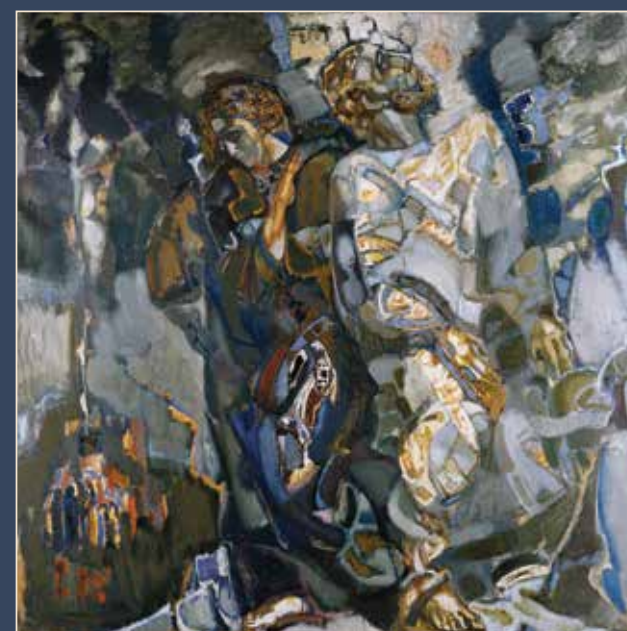
«День и ночь». 1990–1992