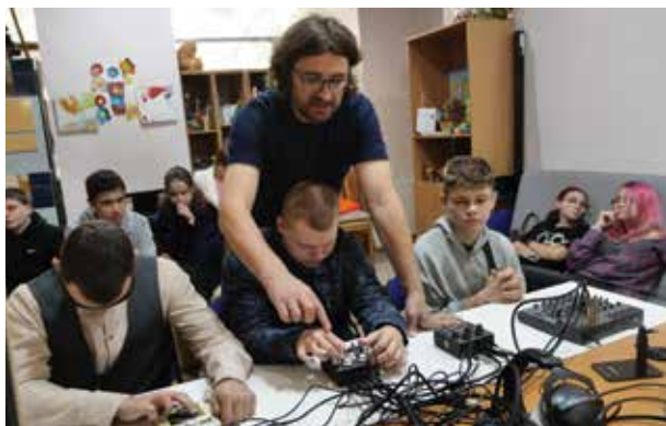
Синтез звука с процессорами Shift Line, без использования мониторов и компьютеров, полностью ручное управление

тестировали и разбирались на практике с профессиональным звуковым оборудованием. Оригинальный сценарий создавался с нуля, его сочиняли дети. Параллельно с изучением техники. Организаторы переключали их деятельность: с обучения и творчества на прослушивание радиоспектаклей, аудиокниг. Подростки научились отличать радиопостановку от аудиокниги, обсуждали звук и музыку. Неко-