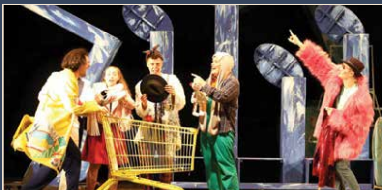
Сцена из спектакля «Бременские музыканты»

193 600 рублей собрали жители Каменска-Уральского для семьи Сапоговых во время марафона в театре «Драма Номер Три». На три спектакля, показанных в тот день, было продано 735 билетов по ценам 250 и 400 рублей. Это абсолютный рекорд всех 16 марафонов «Начало». Плюс к сумме выручки от билетов, городской театр получил еще крупный благотворительный взнос от творческого отдела городского Социально-культурного центра. Его сотрудники и участники клубных объединений внесли 13 600 рублей. Впервые театру удалось собрать больше того, что требуется. Устойчивые ходунки для одной из сестер Сапоговых — Таисии стоят 150 тыс. рублей. Остальные деньги пойдут на оплату реабилитаций, которых этой семье требуется очень много. Для того, чтобы обеспечить своим дочерям постоянное прохождение реабилитаций, их отец ушел на СВО.