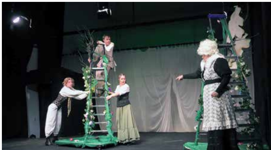
Эскиз «Бабушкины попугаи»

«Отмечая нынче 225-летие театрального дела в Ирбите