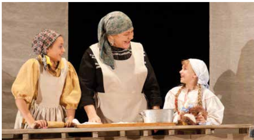
В роли Голды в «Поминальной молитве»

Как абсолютно счастливое состояние воспринимает актриса возможность поговорить со зрителем про жизнь на основе хорошей драматургии. И это солнечное ощущение не способны испортить ни спуск по сценической горке на больной ноге, ни ружье, которое никак не поддается женским рукам, ни клюшка для гольфа — совершенно непонятное для русской женщины приспособление... Все это вполне преодолимые трудности, которые не мешают актрисе снова и снова выходить на сцену и ощущать себя нужной зрителю, театру и родному городу.