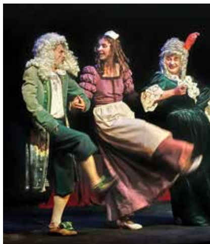
Эскиз «Единственный наследник»

«У вас на сцене тестостерон зашкаливает!». Эта фраза, сказанная на обсуждении эскизов театральным критиком Натальей Киселевой, с явным положительным подтекстом в адрес героев — «попугаев» — вызвала у всех восторг. Наконец-то, мужчины на сцене похожи на мужчин! Сюжет пьесы Хмельницкого дает возможность представить веселую череду уморительных недоразумений. Пожилые родственницы пытаются оградить от знакомства с «коварными и опасными» мужчинами юную Терезу и воспитывающуюся вместе с ней крестьянку Жоржетту. И, когда