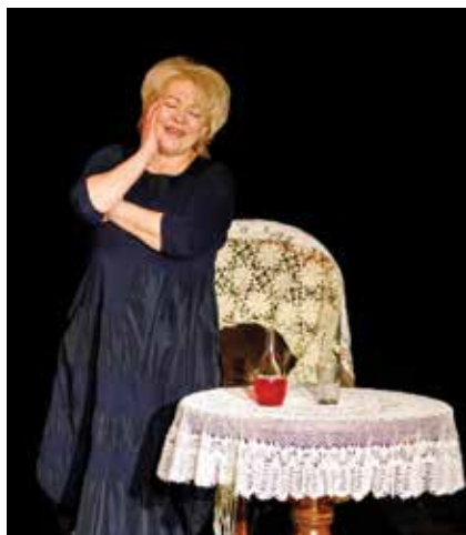
В спектакле «Своим путем»

Фразы из «Зулали» «стреляют» напрямую в сегодняш-