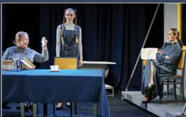
Сцены из спектакля «Гроза»

4 ноября, в День народного единства, в рамках благотворительного марафона «Начало» в Каменск-Уральском театре показали три спектакля: «Комар мечтает о зиме», «Бременские музыканты» и для вечерней публики — «Гроза».