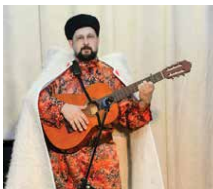
«Ой, то не вечер...»

ния я быстро меняю несколько костюмов, использую реквизит. В дальнейшем планирую исполнять все под оркестр, и это будет действительно близко к шоу (но только по форме!). Например, в этом году много работал над тем, чтобы мероприятие, посвященное защитникам отечества от древних времен, не превратилось в банальный «плакат». Я стремился погрузить публику в тему, вызвать эмоции, выстроить драматургию, чтобы хорошо известное предстало в новом свете. Проект «Театр песни» идет уже второй год. В этом формате я могу реализовать все свои творческие типажы: и серьезные, и комические, и лирические, те, что мне доводилось играть на оперной сцене. Это же замечательно, что в одном концерте можно побыть не только князем Игорем или Онегиным, но и разбитным мужичком или лихим гусаром.