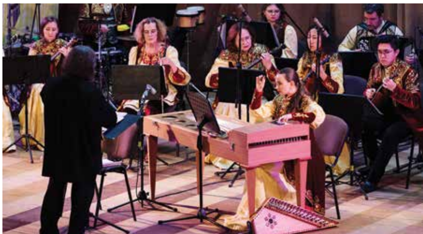
Оркестр русских народных инструментов «Метелица»