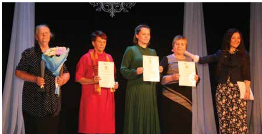
Награждение в номинации «За лучшее литературно-художественное произведение»