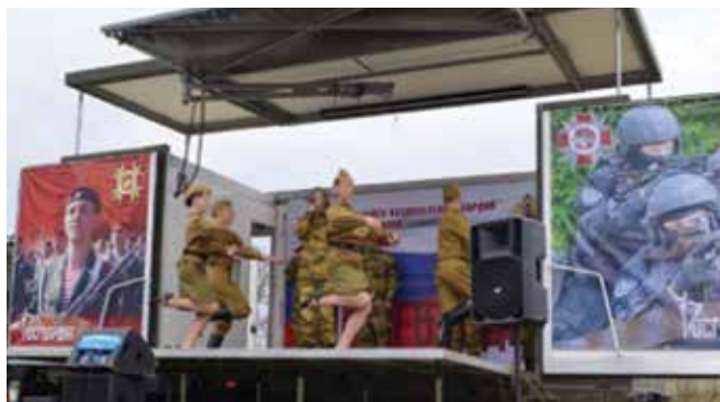
Концерт в «горячей точке»

— Вот ребенок приходит в музыкальную школу, берет инстру-