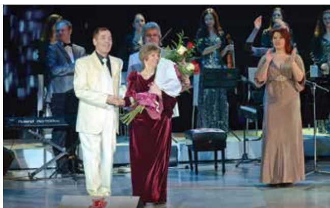
Авторский юбилейный концерт Евгения Щекалёва