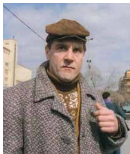
Сергей МАКОВЕЦКИЙ на съемках фильма «Макаров» в Екатеринбурге