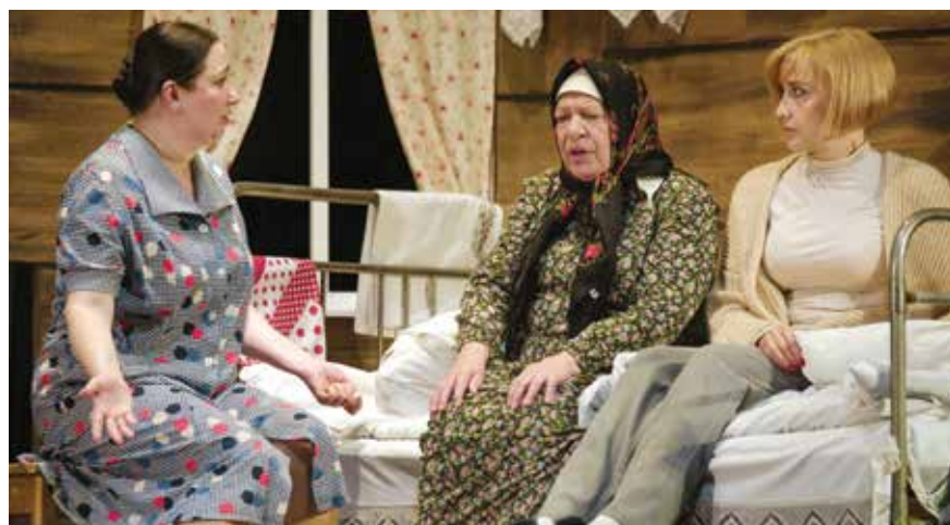
В спектакле «Последний срок»

Вспоминает актриса свои «программные» роли. Мудрая