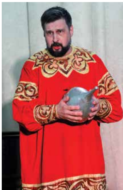
Ария князя Игоря из одноименной оперы А. Бородина

Но, честно говоря, мне не хватило присутствия в зале молодежи и даже детей. Почему? Думаю, музыкальная классика — одно из самых сильных средств патриотического воспитания (в театрализованном формате — еще и необычное «наглядное пособие»). Знаю по себе: произведения, которые я слышал на уроках музыки еще в советской школе, оставили неизгладимое впечатление. А ведь это как раз были, например, ария Кутузова из оперы «Война и мир» Прокофьева, ария Сусанина, хор «Славься» из оперы Глинки «Иван Сусанин», песни «Бухенвальдский набат», «День Победы»... И ощущение их значимости в любви к родной земле возникло задолго до того, как я сам стал их исполнять.