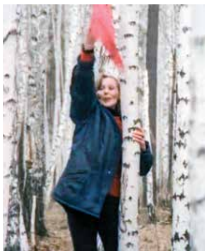
В фильме «Макаров»

вы хотите? Я отвечаю, несколько не хочу. Ну, мол, вы же, все-таки, старались. Я, говорю, зарплату получаю, я же не агент. Когда буду вашим агентом, то 10% с вас буду получать с удовольствием. А так я работаю в группе, работаю на группу и никаких денег никогда ни у кого не возьму. Я не знаю, может быть, такая практика и существует, но у меня отношения с актерами доверительные, такие, что как-то это им и неудобно.