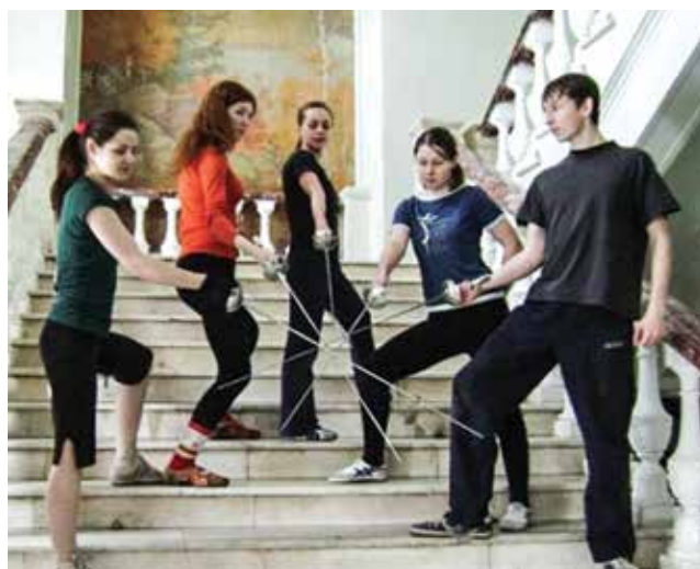
Выпуск 2008 года