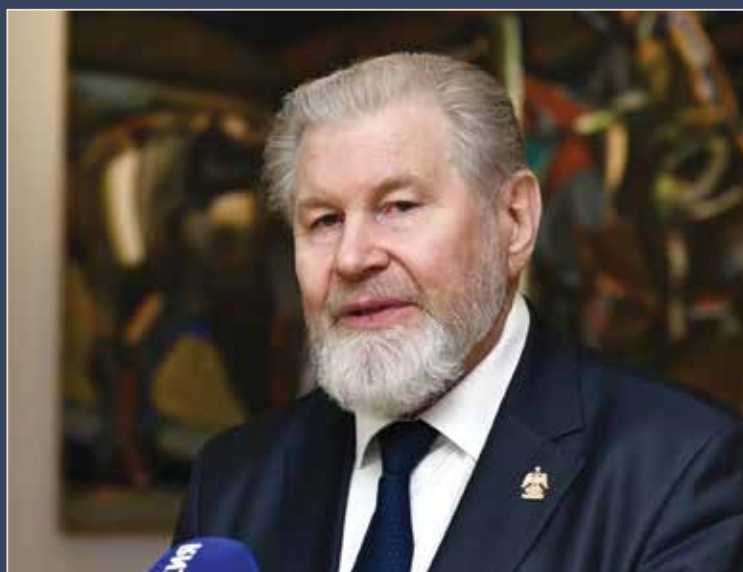
Художник Виктор КАЛИНИН