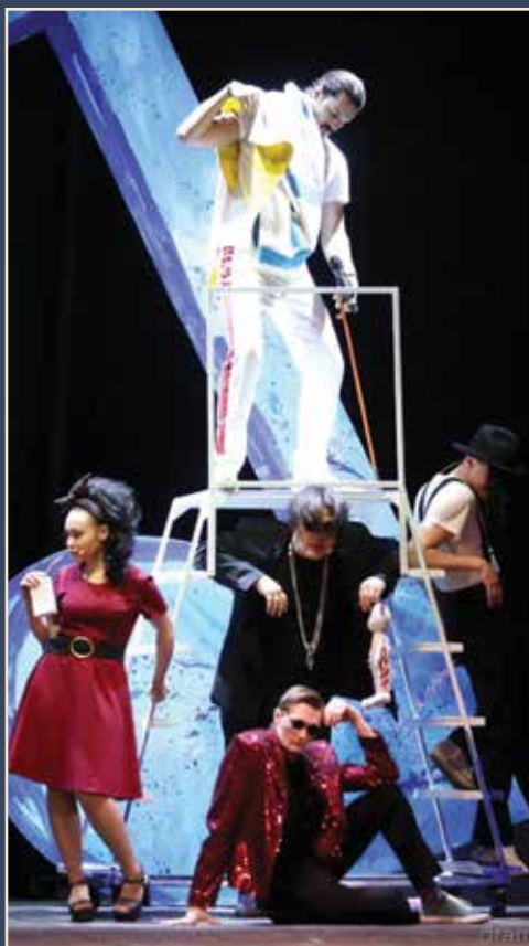
Сцена из спектакля «Бременские музыканты»