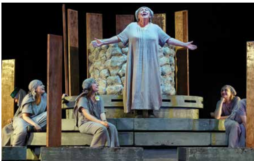
В роли Кошкиной в спектакле «Весталка»