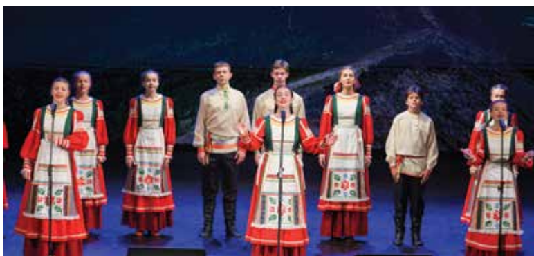
Коллектив детского центра народного искусства «Озорное колесо»