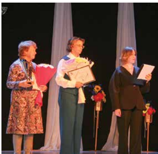
Лауреаты в номинации «За пропаганду литературы, творчества и продвижение чтения»