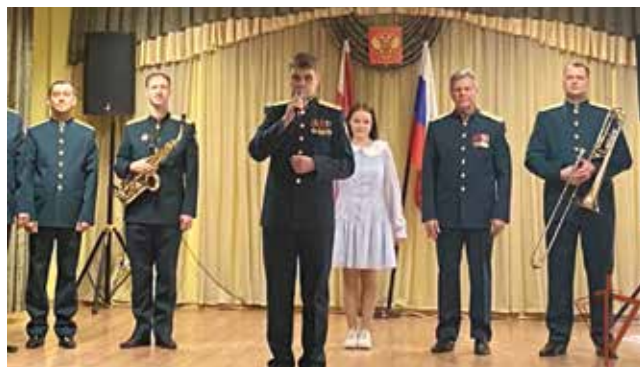
Песня о Нацгвардии