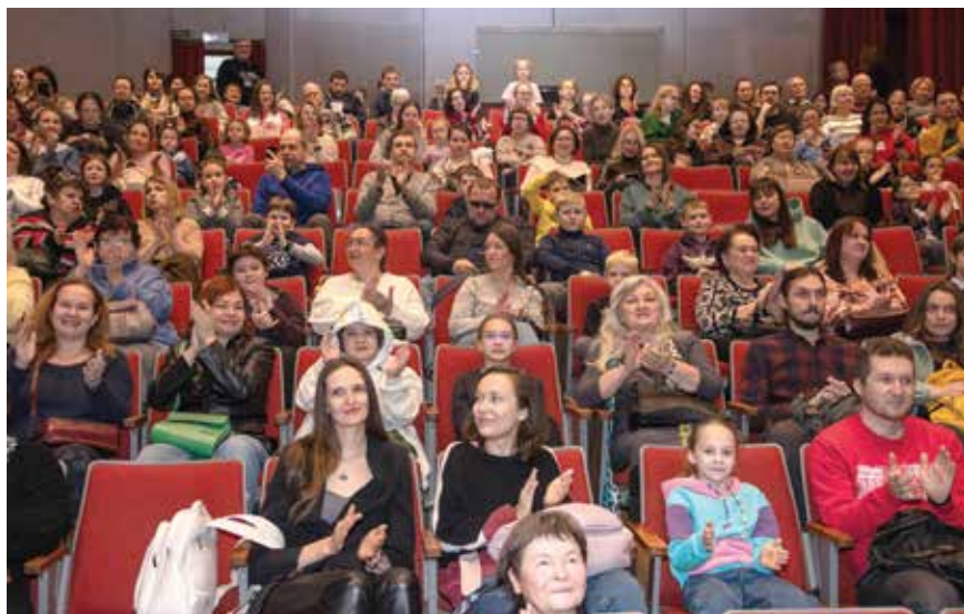
В зрителях недостатка не было