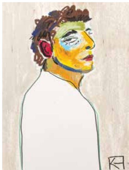
«Париж». Из серии «Портреты моей души»

Какие они, герои полотен Каролины Фейгиной? Лица некоторых, без определенных черт, казалось, не выражают эмоций, но настроение на каждом холсте