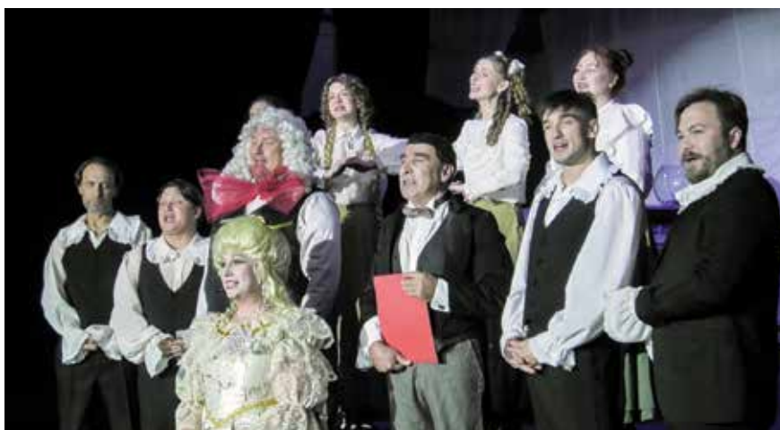
Эскиз «Лекция о вреде табака»

с юмором. В своей комедии он представил далеко не идиллическую картину нравов французского общества XVIII века. И сегодня зритель увидит в ней отражение современных реалий. Никуда, к сожалению, не делись жажда обогащения, мошенничество, лицемерие... Так что веселая внешне пьеса наводит на серьезные размышления о нашей сегодняшней жизни, о нас... Работать над эскизом было очень интересно, каждый актер раскрывался по своему, вносил в роль какие-то свои мысли, репетировали легко и азартно...».