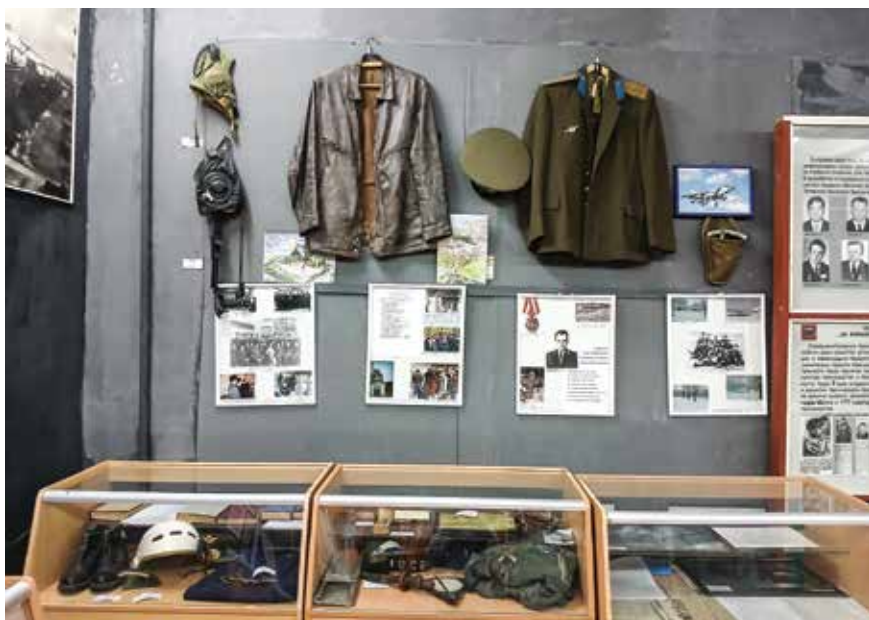
Личные вещи летчика Сафронова

руды и направляют в вагонетки. Шахта — это же целое предприятие... Часть этого уже разрушена, к сожалению. Но на тот момент, когда музей создавался, такая панорама была реальностью. Обычно во время экскурсии мы говорим детям: «Закройте глаза! А теперь представьте, какая под землей темнота, да еще и шахтные воды, с содержанием серы. Тяжело было нашим шахтерам работать под землей с переносными масляными светильниками с блендой — специальным козырьком, который позволяет акцентировать световой поток