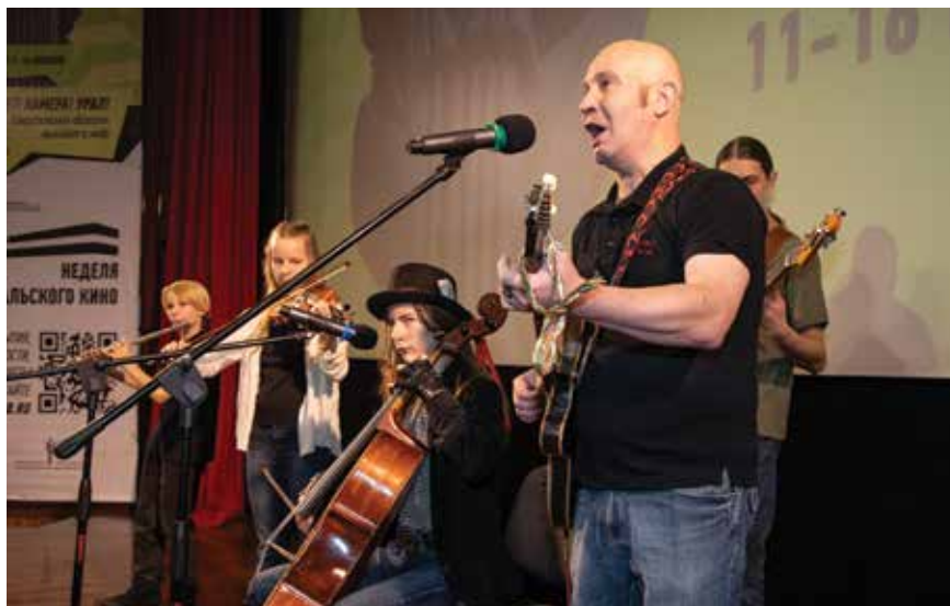
Герои фильма Кирилла Верховина «Колхандра»

Фильм «Колхандра», снятый режиссером Кириллом Верховиным на московской студии, попал на неделю Уральского кино