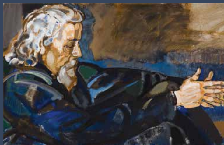
«Портрет композитора Юрия Буцко»