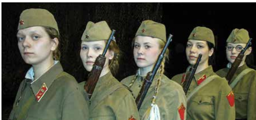
Спектакль «А зори здесь тихие...»