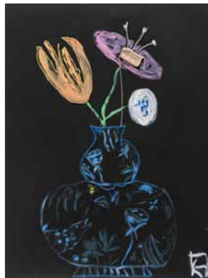
«Цветы ночи». Из серии «Цветы»