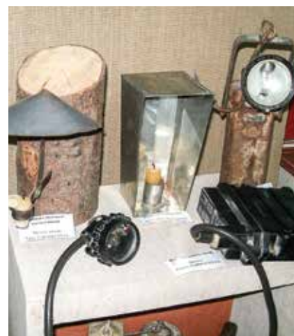
Коллекция шахтных светильников, с которыми шахтеры спускались под землю. Передано Дегтярским рудоуправлением