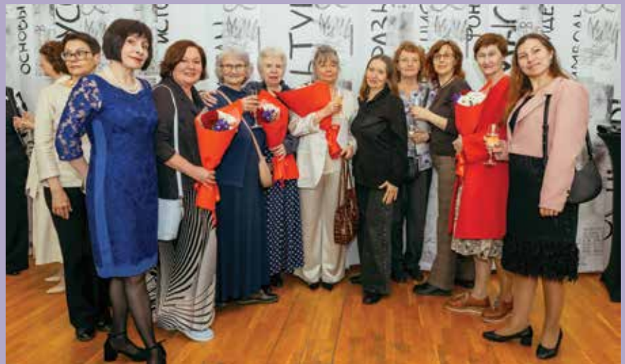
Музейщицы разных поколений, красавицы, умницы, подвижницы – да и просто музы

Все эти мероприятия – своего рода встряска сознания, ведь глубинный смысл встреч на территории ОМПУ, это наше приобщение к литературной карте города и края, обретение пространства, которое в свое время наши земляки-писатели попробовали вочеловечить в образах. И у них получилось!