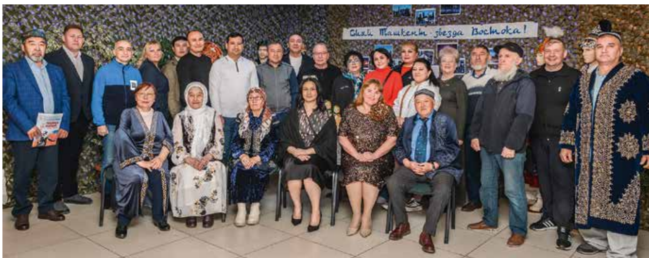
Участники встречи – общее фото на добрую память

Ирбитская земля на протяжении столетий была домом для множества народов, которые научились налаживать добрососедские отношения, сохраняя самобытность, уважать традиции и культурные особенности соседей. Вот и все участники нового музейного проекта «Наследники Победы. Дружба народов в годы Великой Отечественной войны» объединились в едином стремлении – к миру на планете.