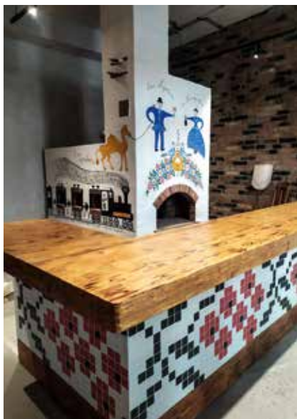
Роспись бара и русской печи

и участницей ряда экспедиций по фиксации и описанию уральской росписи в Алапаевском, Тугулымском, Ирбитском, Сухоложском и других муниципалитетах Свердловской области, что позволило познакомиться не только с музейными коллекциями, но и с «живыми» осколками кистевой росписи в интерьерах крестьянских изб, которые еще сохранились. Кропотливо изучала уникальную роспись по дереву