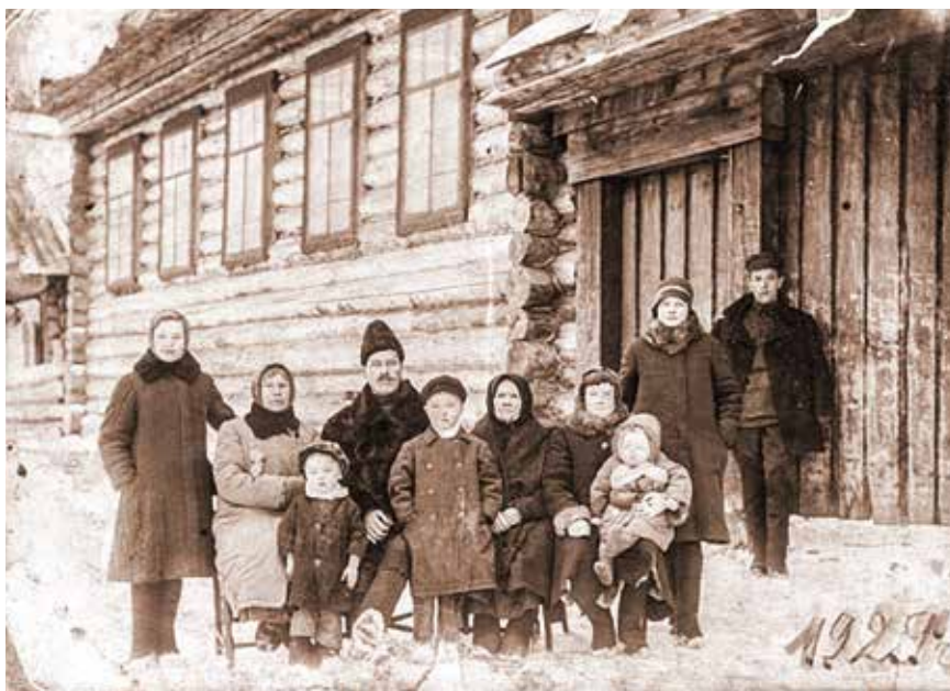
У родительского дома — мать, отец, маленький Володя и их большая семья