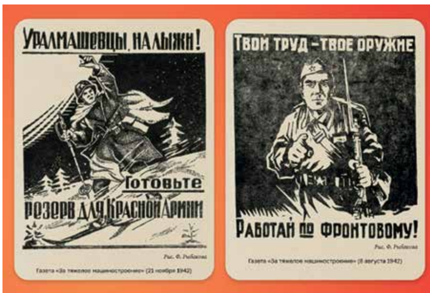
Заводские плакаты военного времени

водской столовой: «Есть не могу, ложка вываливается из рук, так болят пальцы...».