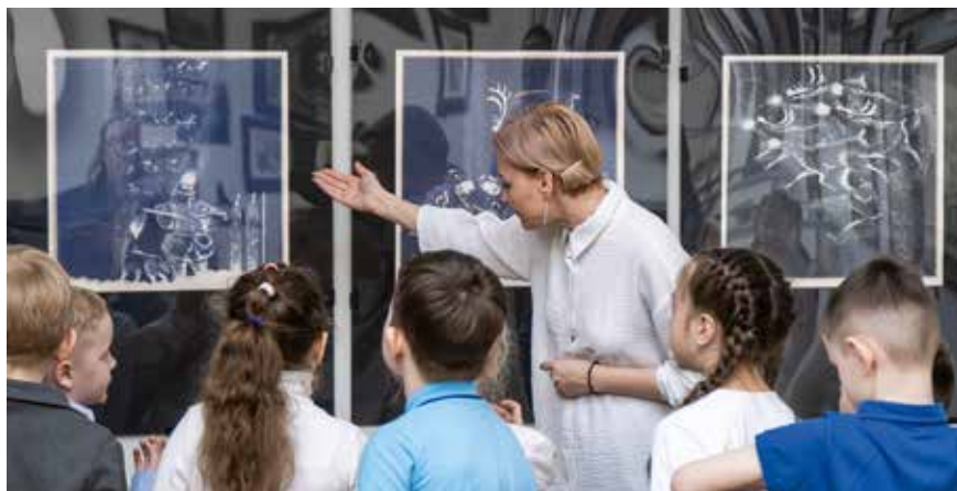
Экскурсия по выставке