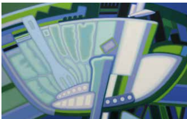
«Любовь моя, цвет зеленый»

Новая выставка, а это более ста живописных и графических произведений, включает несколько знаковых серий: «Земля», «Пермские боги», «Красное