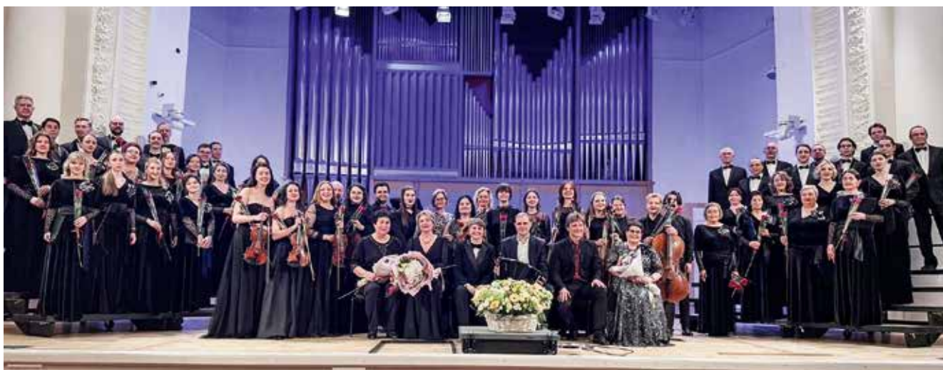
После концерта. Фото всех его участников

Концерт стал настоящим торжеством искусства и откровением: вместе с артистами на сцене, публика, затаив дыхание, вслушиваясь в звуковые лабиринты, подчинялась магии музыки. Финал вечера был волнующе красив: продолжительные овации, роскошные букеты и пламенеющие розы, подаренные всем артистам, сотворившим этот праздник!