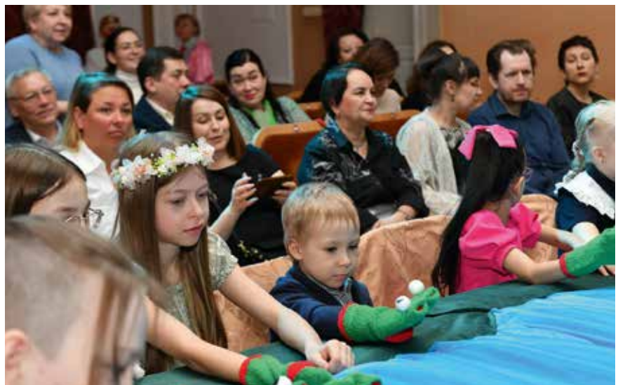
Зрители спектакля «Лягушка-путешественница»