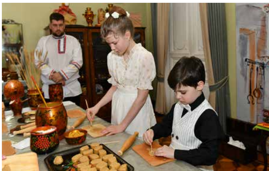
Мастер-класс по производству пасхальных жаворонков