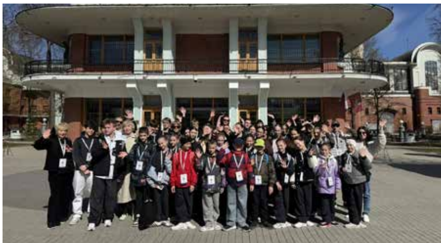
Труппа «Щелкунчика» – участник конкурса «Золотая Маска» – в Москве