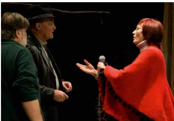
На репетиции спектакля «Поминальная молитва», который был удостоен Губернаторской премии

Мы возили спектакли в Москву, участвовали в «Артмиграции», в фестивале театров малых городов России, в местных проектах. Театр стали узнавать, замечать, приглашать. На областном фести-