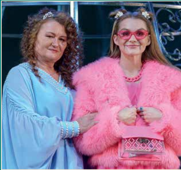
Сцены из спектакля «Пигмалион»