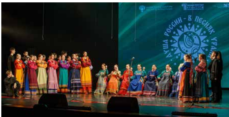
Ансамбль музыкального училища имени Чайковского

Тут надо понимать: речь идет, конечно, и о собственно участии молодых в статусном соперничестве. Но не только. В рамках конкурса профессионалы жанра, в том числе члены жюри, продолжали общение с молодыми помимо сцены. Давали бесцен-