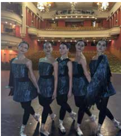
Балерины «Щелкунчика» на сцене «Новой Оперы»