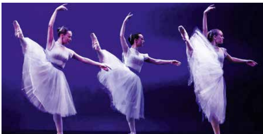
Те самые батманы, что так мучили в классе

Через танец смотрит на мир. Танец ее путеводная звезда. Балет и только Балет из поклонницы сделал ее повелительницей танца. Хотя так она звалась от рождения: Таня в переводе с греческого – Повелительница. Но потребовались годы, чтобы имя начало соответствовать