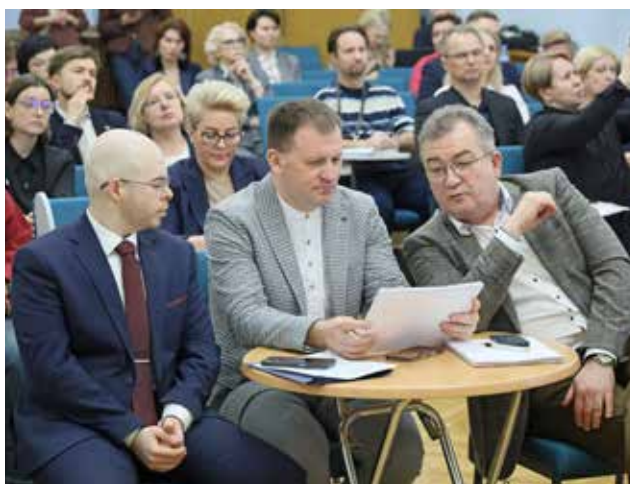
Идет деловая программа

Если вспомнить историю, то екатеринбургский хоровой сам-