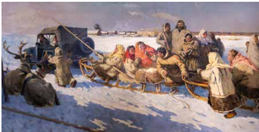
Владимир Игошев. «В праздничный день». 1958-60

Игошев создал живописную летопись жизни коренных народов Северного Урала с его суровым климатом и мужественными, открытыми людьми. Излюбленный жанр художника – портрет, но обращался он и к сюжетной картине. Одно из больших жанровых полотен «В праздничный день» было передано в 1961 году министерством культуры РСФСР в Нижнетагильский музей изобразительных искусств. Произведение выполнено в 1958-60 годах, хотя задумано оно было еще во время первой поездки на Север в Суеват-Пауле. Художник увидел эту