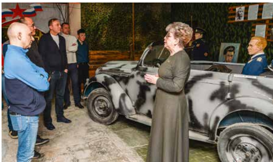
Гости в экспозиции музея, посвященной Николаю Кузнецову

Начиная войну против Советского Союза, фашистское руководство рассчитывало на обострение межнациональных противоречий внутри нашей страны, надеясь, что многонациональное советское государство рухнет при первых же ударах вермахта. Однако этого не произошло: дружба народов с честью выдержала испытания войной.