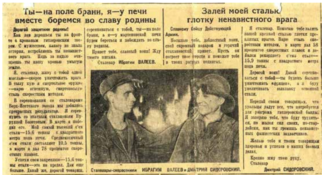
Публикации в заводской газете