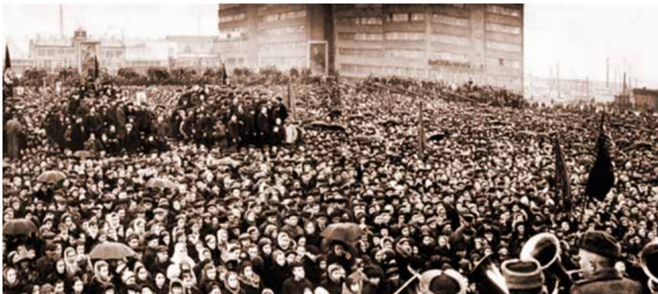
Митинг на площади Первой Пятилетки 9 мая 1945 года