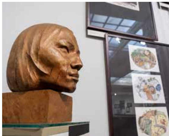
Скульптура Василия Ушакова «Северянка». 1971

Большой раздел выставки «По следам северного оленя» посвящен коренным народам Крайнего Севера России — ненцам, эскимосам и чукчам. Например, это линогравюры заслуженного деятеля искусств Коми АССР Анатолия Бухарова (1931-1995).