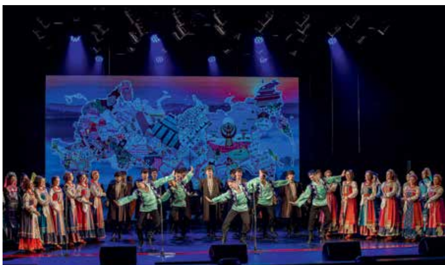
Присутствие прославленного Уральского народного хора стало камертоном конкурса

в стол. Сцена – как лакмусовая бумажка».