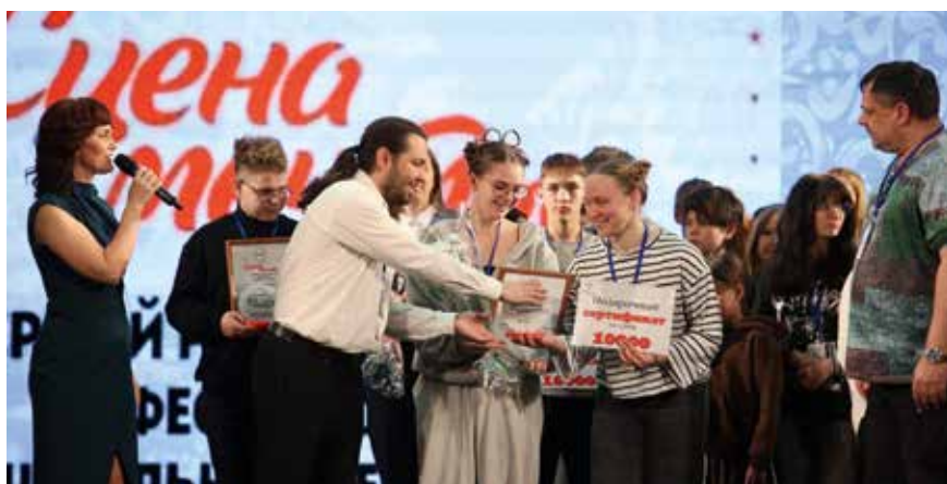
Ни один коллектив не уехал без наград

продумано до мелочей и рассчитано по минутам. А как нас встретили! Слово мы — настоящие артисты, приехавшие на гастроли! Это было потрясающе — выйти на сцену любимого Елизаветинского зала и увидеть, что все работали для нас и вместе с нами: осветители, звукорежиссеры, реквизитеры, помреж... Спасибо драмтеатру за все! Теперь мы будем с нетерпением ждать второй фестиваль, и прямо сейчас начнем готовиться к нему».