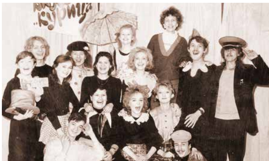
После премьеры спектакля «Кукарямба» в театре «Эльдорадо»