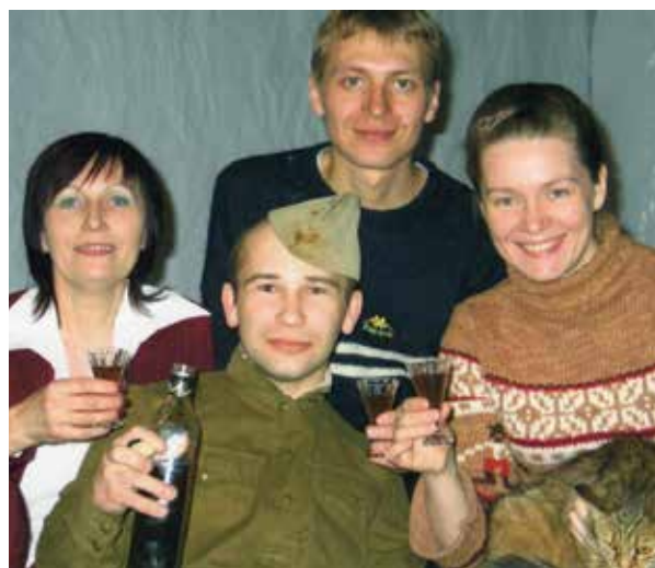
После премьеры спектакля «Мой бедный Марат» в «Эльдорадо»