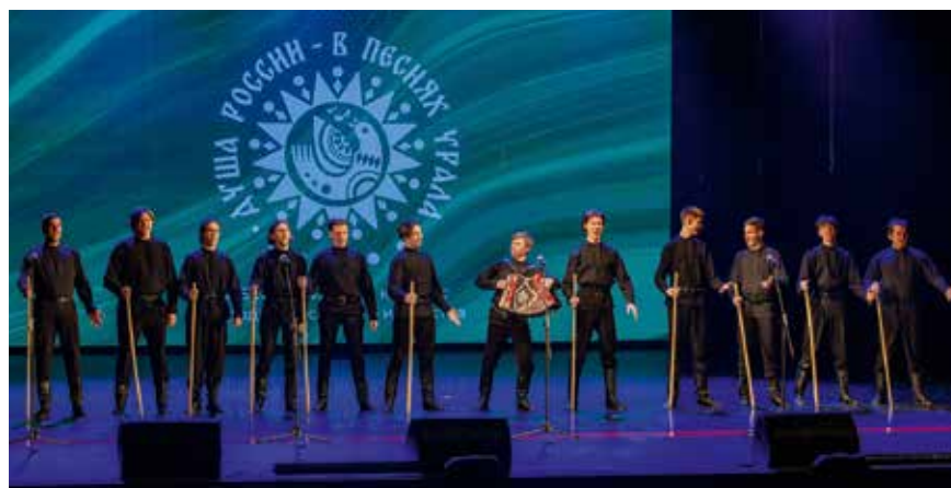
Мужской хоровой ансамбль «Ладья» из Екатеринбурга

Паваротти, плюсах и минусах позднего и раннего прихода в народно-песенное исполнительство, а также о том, что не дается в училищах-консерваториях, а дано от Бога – о голосе. И как его стоит ценить и беречь. А некоторые выношенные певческим опытом «итоги и выводы» Марины Девятовой звучали почти как афоризмы. Правила профессии. «Я никогда, ни на каких конкурсах не занимала первых мест. Не это важно. Главное – свое место в профессии, выстроить свою певческую жизнь». «Выйдя на сцену, ты отвечаешь за все. Криво висит афиша, плохое освещение, слишком громкий аккомпанемент – виноват артист». «Как складывается репертуар? 10 песен записала – пять уйдут