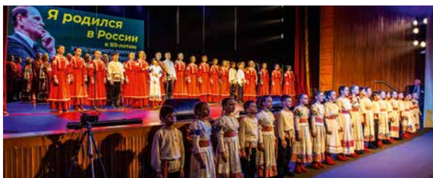
Песню «Мудрой будь, моя Россия» исполняют Уральский народный хор, хор русской песни телерадиоцентра «Орфей» и фолк-шоу-группа «Озорное колесо»

В лирических песнях «Под окном черемуха колыхнется», «Мамонька, родная», «У меня под окном расцветала сирень», «Позарастили стежки-дорожки» и других незатейливые пейзажные зарисовки органично сочетались с внутренним душевным состоянием, лишенным всякой помпезности. Новые творческие замыслы нашли отклик в сердцах людей. Зрительные залы уже