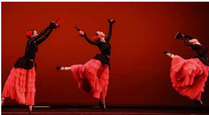
Номер из концерта