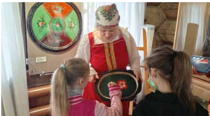
Мероприятие «В поисках волшебного цветка»

Вот основные принципы проекта. Интерактивность: известно, как важна для детей игра. Дошкольнику трудно выдержать традиционную экскурсию. Поэтому в проекте есть короткие видеолекции (от 6 до 10 минут) и интерактивные мероприятия, которые проходят в игровой форме, с элементами театрализации, мастер-классов и «бро-