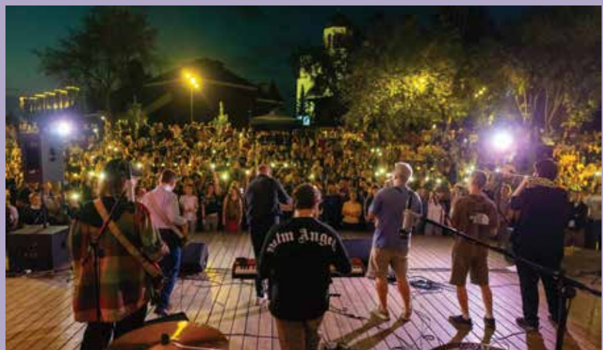
И музыка играла – рок

...В изначальном – том, что на Пушкина, 27 – Литмузее уже был раздел («уголок»), отведенный жизни и книгам Бажова, что не удивительно, учитывая значение сказов для развития отечественной литературы. К тому же, Павел Петрович многое сделал, чтобы мемориальный музей литератора-предшественника состоялся.