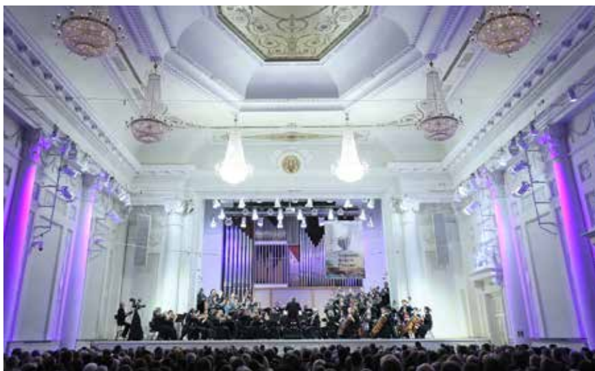
Исполняется «Реквием» Сальери. Симфонический хор и Уральский филармонический оркестр. Дирижер — Андрей ПЕТРЕНКО

Главный посыл события можно было осознать и почувство-