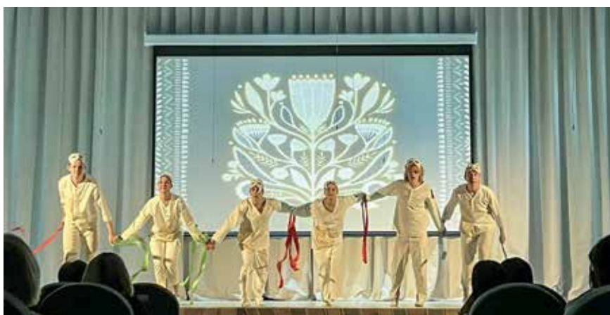
Спектакль «Ангелофрения» (Серов. Школа № 21)

«Мы увидели уже вполне себе взрослое высказывание – раз-