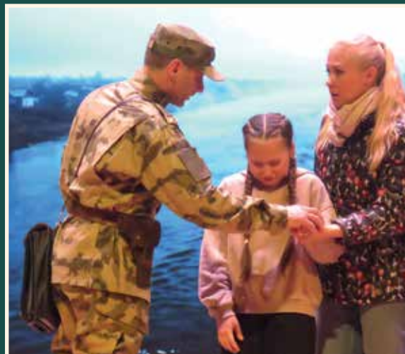
Зрители в финале спектакля