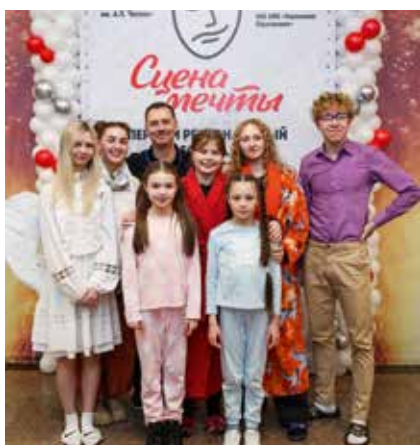
Побывали на сцене мечты