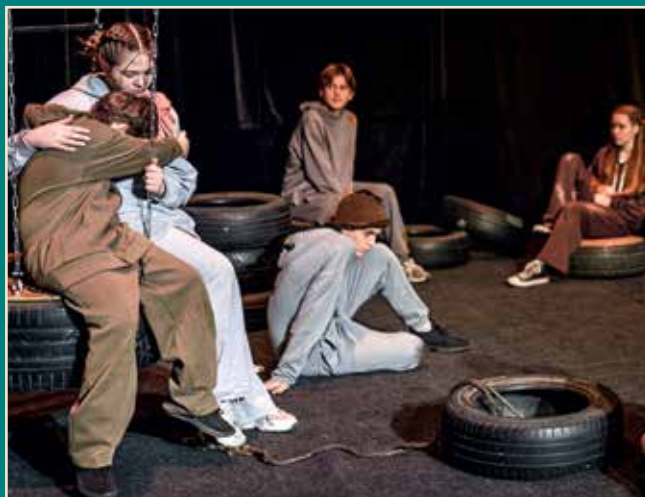
Сцены из спектакля «Овраг»