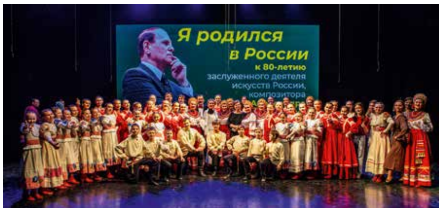
Финал концерта. На сцене — все его участники