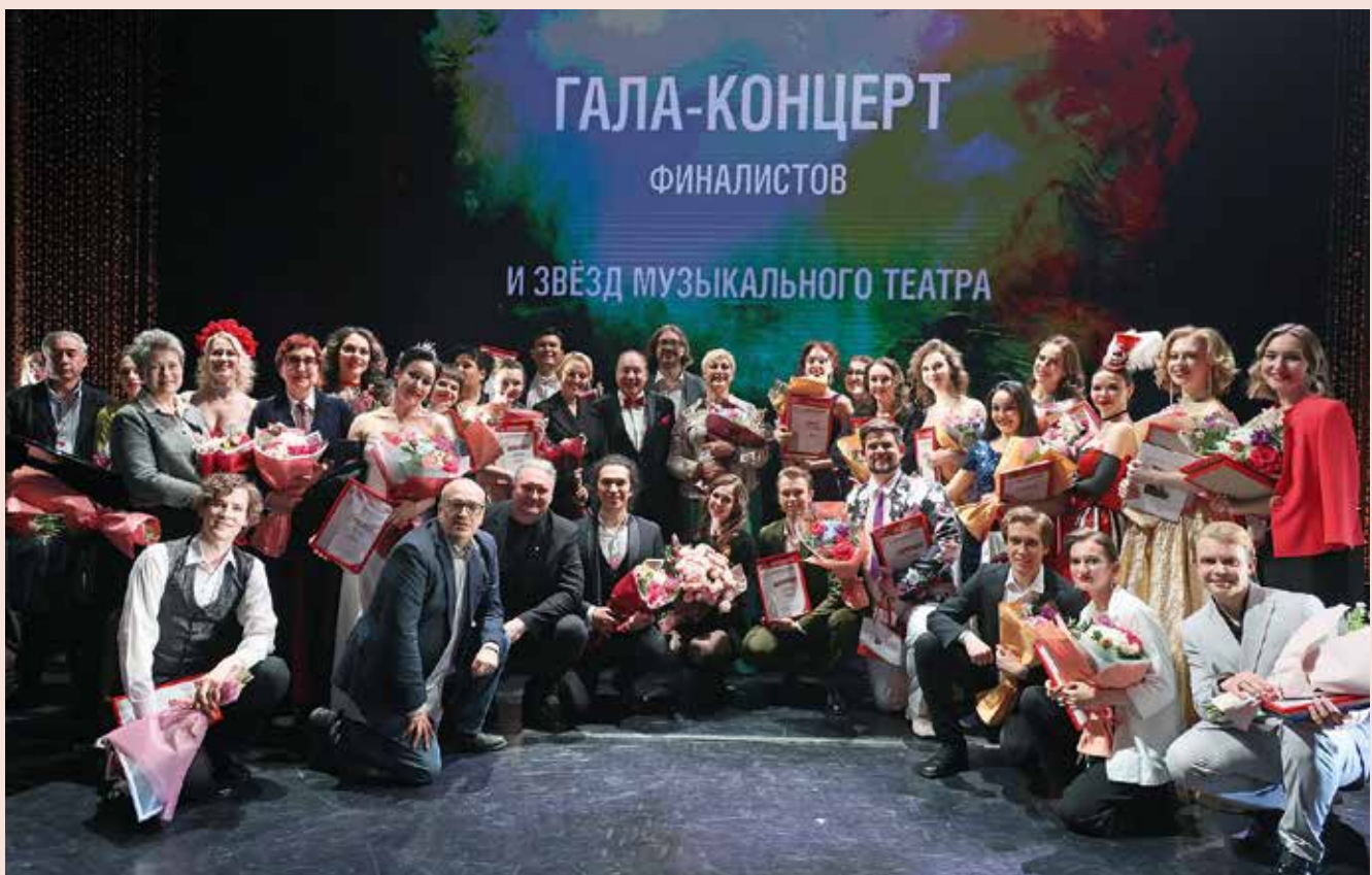
«Мы все служим музыке и театру!». После гала-концерта

спектакль на основе российского материала (который, скорее всего, будет неинтересен Европе или Америке) – работает сила нашей драматургии. А если еще добавить композитора, художников да классных актеров – все будет хорошо!