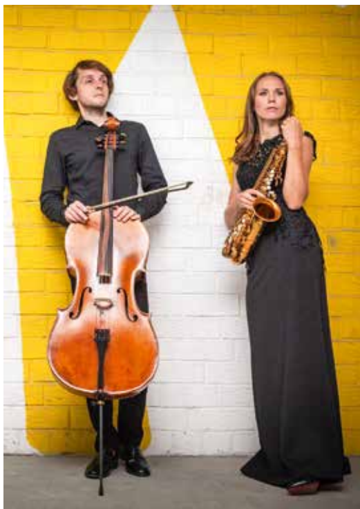
Дуэт Sax_CelloDuo в этом году отмечает свое 10-летие