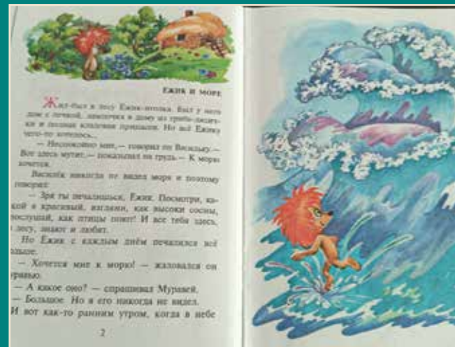
Страницы книги сказок Сергея Козлова