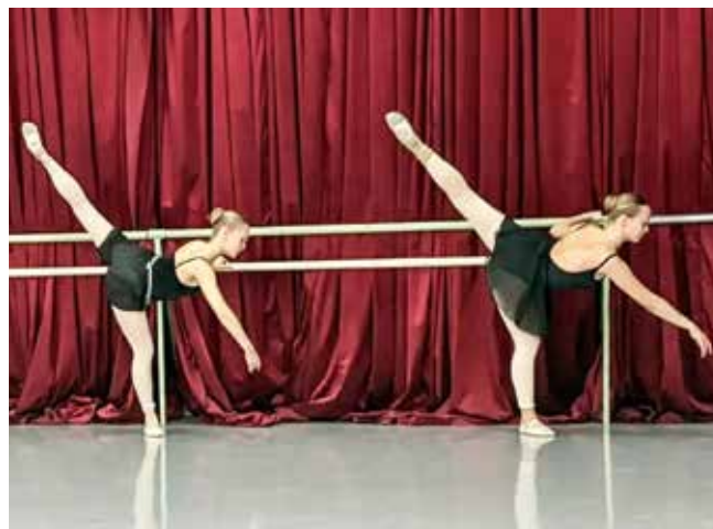
У балетного станка. Батман, еще батман!