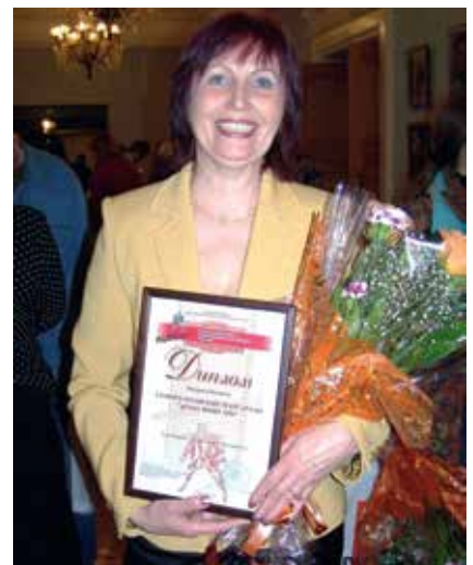
На фестивале «Помост» в Новокуйбышевске

шили, что настоящее богатство — духовное. Так и назвались.