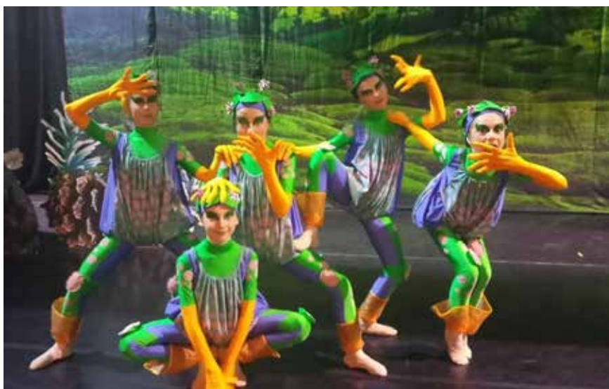
Спектакль «Дюймовочка». Показ на «Золотой Маске»