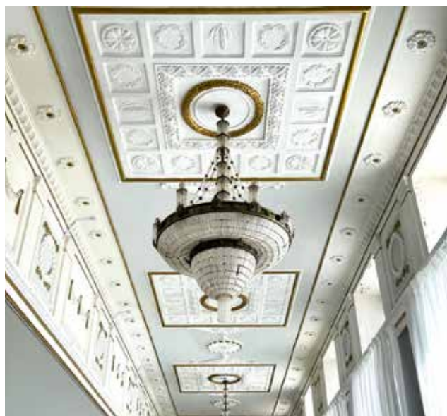
Люстра в фойе Дома музыки