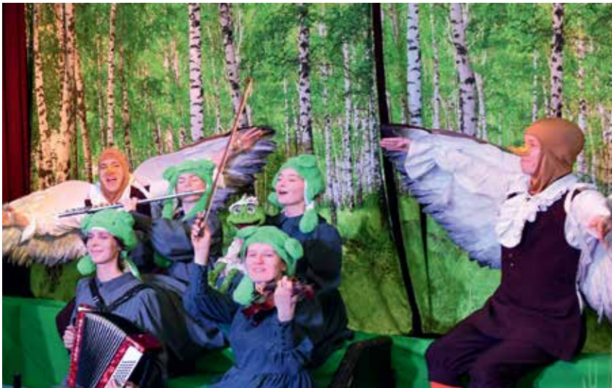
Сцена из спектакля «Лягушка-путешественница»