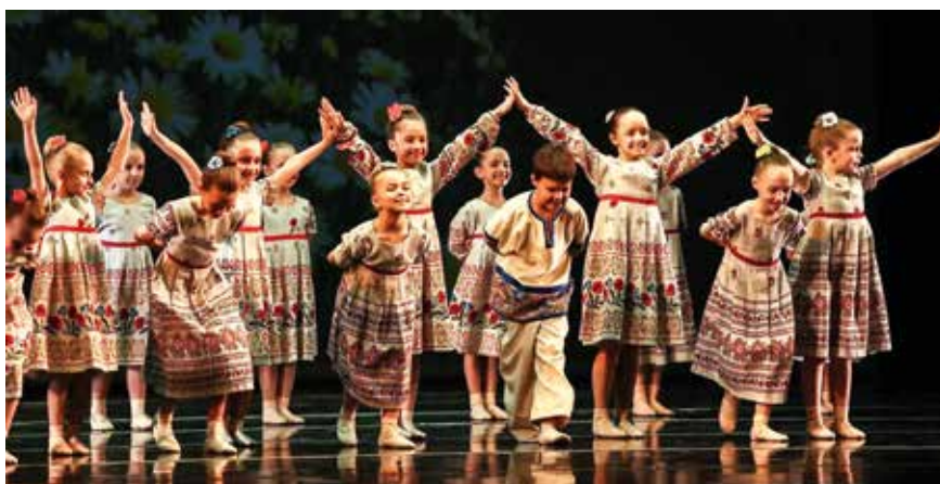
И народный танец — можем

Уверен. Майя Плисецкая говорила: «Если до успеха надо сделать только шаг, я дойду и сделаю».