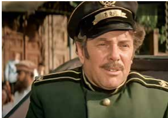
В фильме «Приваловские миллионы»