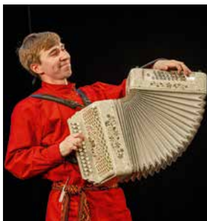
Эх, пой-играй, гармонь...

сиях (да, случаются!), и о преодолении форс-мажорных ситуаций на сцене, и о том, что «в любом концерте начать выступать без распевки – все равно что выйти на сцену и рвануть гирю». Был заинтересованный разговор о секретах «гигиены голоса» и опыте