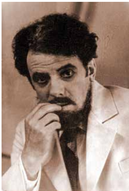
В роли Лопухина («Вишневый сад»)