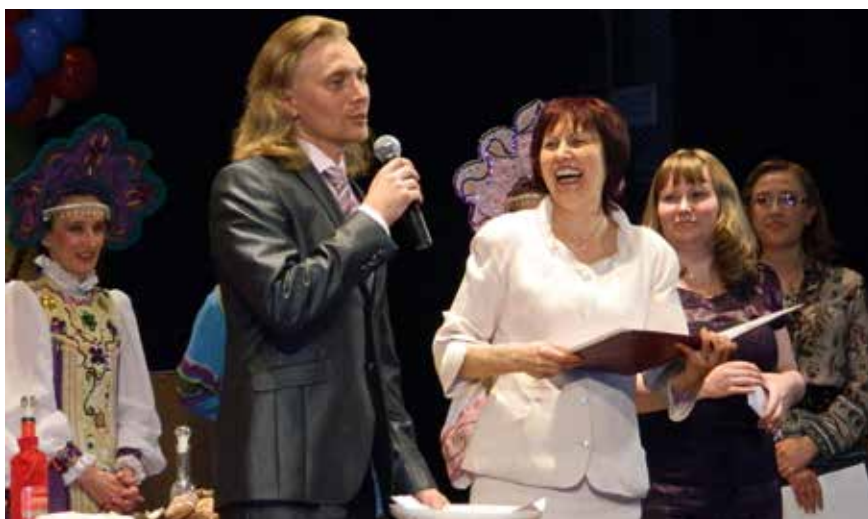
После спектакля «Баба Шанель»

— Да, есть. Меня сейчас очень волнует история Каменского театра. Я занимаюсь архивом, раз-