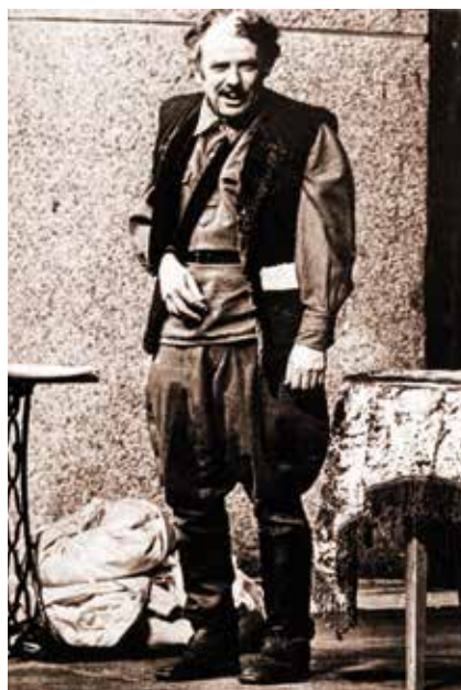
В роли Егорыча («Отпуск по ранению»)