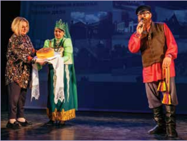
Из Сысерти, из Музея Павла Бажова, привезли каравай