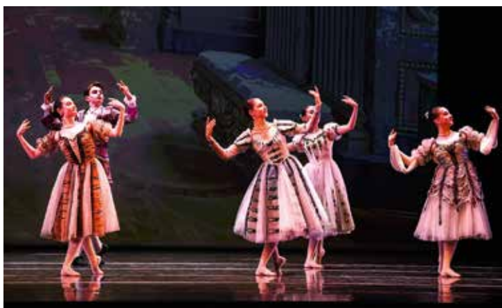
Номер из концерта. Старшие – уже балерины...