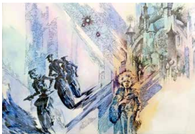
Евгения Стерлигова. Иллюстрация к повести «Гуси-гуси га-га-га»