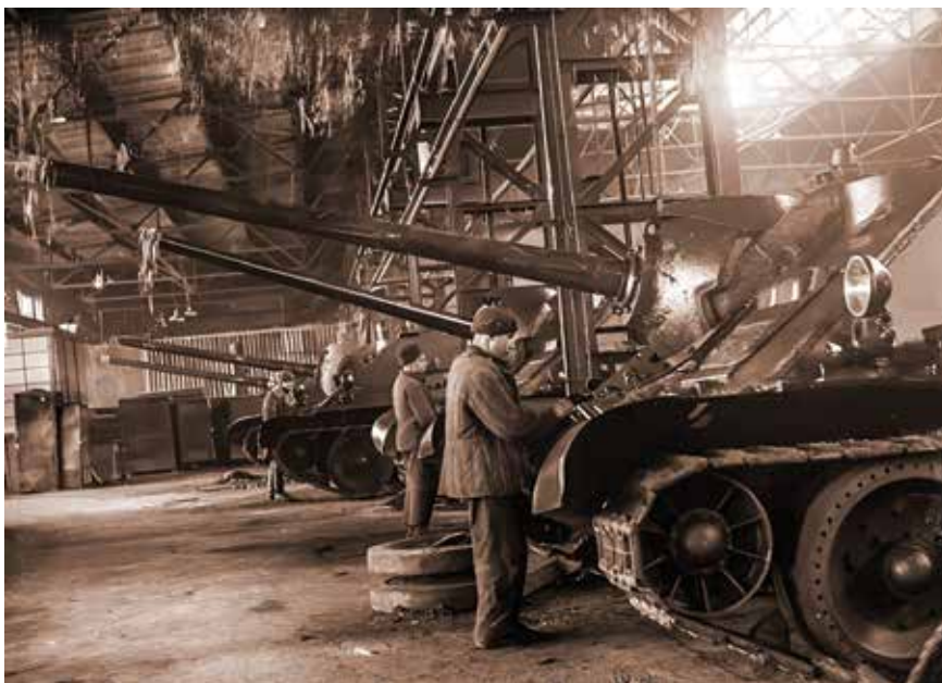
В цехе Уралмаша