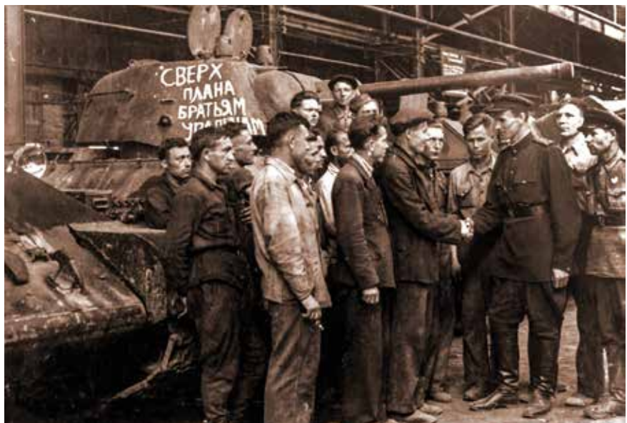
Передача танка Уральскому добровольческому танковому корпусу