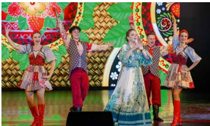
Заслуженная артистка России Марина ДЕВЯТОВА в гала-концерте конкурса

В ответ же на вопрос искренне рассказала и о своих депрес-