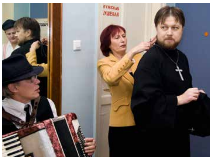
Перед спектаклем за кулисами

В 1974 году я стала вести театральную студию при ДК «Строитель». Это оказалось невероятно увлекательно. Ко мне пришли интереснейшие люди, и началась очень интересная жизнь. Через два года наш спектакль «Девочка и апрель» получил первое место на городском смотре самодеятельности. Мы решили, что у нас родился настоящий молодежный театр, которому нужно имя. Я пришла домой, взяла словарь, открыла его и увидела слово «Эльдорадо». Подумала: какое красивое слово. Да, Эльдорадо — страна сказочных богатств, но мы ре-