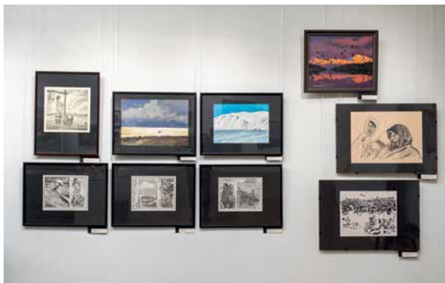
Фрагмент экспозиции — работы Владимира Истомина

Кроме картин Игошева, раздел выставки, посвященный Приполярному Уралу и его коренным народам, представляют произведения тагильского художника Геннадия Горелова (1938-2009) на тему индустриализации края,