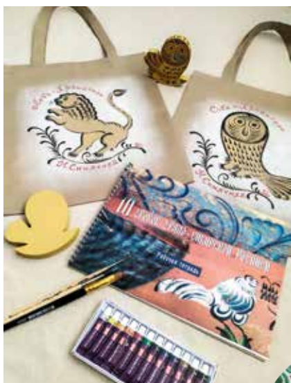
Рабочий инструмент мастерицы

и постепенно прирастала единомышленниками. В 2023 году стала руководителем новой творческой студии-мастерской «Белая горница». Это уже не просто студия по обучению росписи, а артель творческих людей, где есть возможность сообща осуществлять выставочные проекты для музеев, участвовать в конкурсах, фестивалях, ярмарках. В коллективе студии и профессиональные художники, и фольклористы, и даже потомки тех «красильщиков», что создавали на Среднем Урале в конце XIX-начале XX века знаменитые расписные дома «со цвяточками». В настоящее время студия работает над передвижным выставочным проектом для Свердловского областного краеведческого музея имени Клера на тему «Уральская прялка», который будет представлен в 2026 году в четырех филиалах музея.