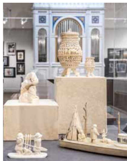
Фрагмент экспозиции Уэленской косторезной мастерской