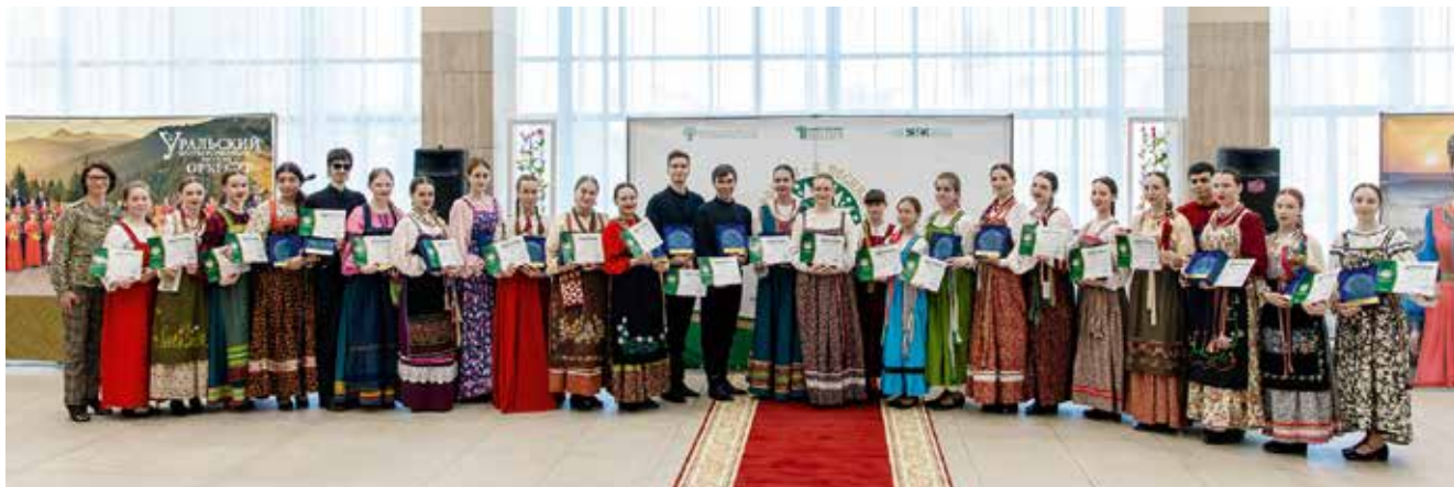
Лауреаты конкурса. Фото на память

Сегодня в стране существуют всероссийские конкурс-фестиваль исполнителей народной песни имени Надежды Плевицкой в Курской области, конкурс исполнителей народной песни имени Лидии Руслановой в Саратове. Пять лет назад к ним добавился конкурс народно-песенного исполнительства в Екатеринбурге. География и статус участников различаются, но цель одна – популяризация народной песни, сохранение ее традиций и выявление самобытных талантов. А наш, уральский конкурс выявил их немало.