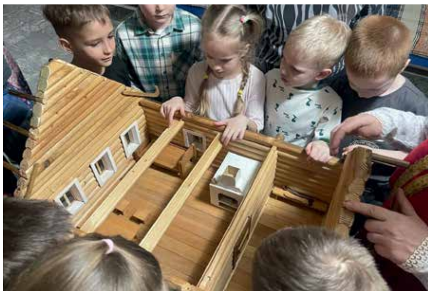
Мероприятие «Дом для домовенка Кузи»