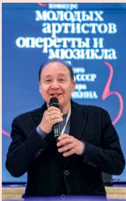
Председатель жюри Максим ДУНАЕВСКИЙ

Прибавившееся нынче участие студентов музыкальных вузов – тоже отличительная особенность юбилейного конкурса Курочкина. И очевидный тренд. Со знаком плюс. Молодые, начинающие рискуют, предъявляют свои творческие амбиции, понимают, как важно пройти профессиональный «обстрел» на большой сцене. Тем более – в прославленной Свердловской музкомедии, где на тебя смотрят не только члены жюри и именитые действующие актеры, но – сами стены этого театра, намоленные опытом и достижениями мэтров «легкого жанра». Другое дело, что молодые порой рискуют в одиночку, без профессионального «пригляда» на стадии выбора и подготовки конкурсного номера. Забавный и грустный факт: конкурс уже вовсю шел, когда Максиму Дунаевскому позвонили его коллеги-преподаватели отделения мюзикла «Гнесинки», озадаченные тем, что студенты уехали на конкурс, не сказав ни о своем участии в нем, ни попросив помощи в подготовке. Такая «самостоятельность» оборачи-