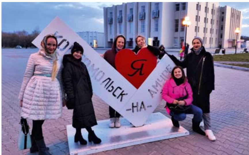
Большие гастроли театра драмы в Комсомольске-на-Амуре

— В Комсомольске-на-Амуре нас принимали очень тепло. А после первого спектакля «Ханума», когда зал аплодировал стоя, многие зрители сразу шли за билетами на следующие постановки, объявленные в гастрольной афише. До этого гастроли драматического театра Комсомольска-на-Амуре с успехом прошли в Нижнем Тагиле, так что мы успели подружиться со своими