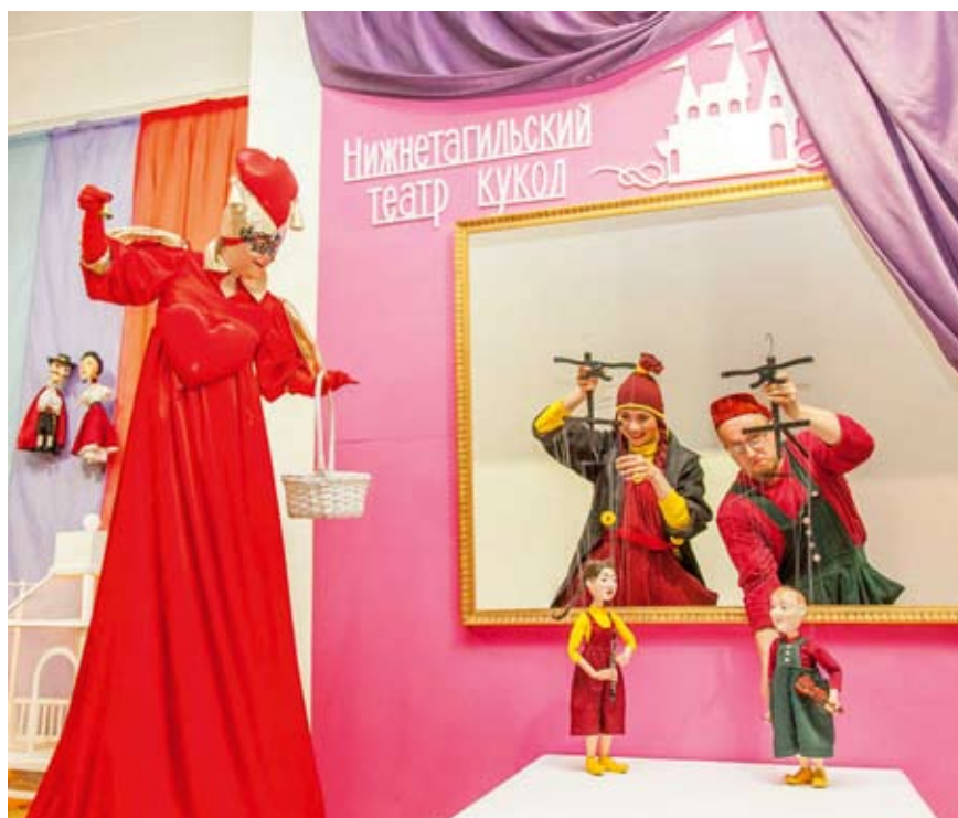
Открытие выставки в Музее изобразительных искусств к 75-летию Нижнетагильского театра кукол

Об интересе публики к мероприятиям Года театра говорят аншлаги у билетных касс, восторженные отклики посетителей тематических выставок в музеях города, количество зрителей на августовских представлениях «Театрограда». Зашкаливало и количество посетителей, принявших участие в майской и ноябрьской акциях с театральной тематикой «Ночь музеев» и «Ночь искусств». Зрители премьерных спектак-