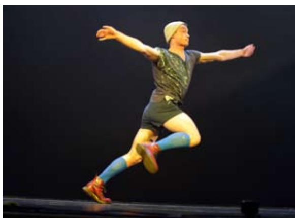
MINOGA dance company (Екатеринбург). «Гекла». Премьера

В разгар неизбежного перехода из осени в зиму на Урале прошел жаркий, страстный, философствующий Международный фестиваль современного танца «На грани». В девятый раз его организаторы и учредитель – Свердловский театр музыкальной комедии – собрали признанных мэтров этого жанра, 20 хореографических коллективов, легендарных и молодых, из Москвы, Казани, Челябинска, Перми, Екатеринбурга, Омска и из столицы Эстонии – Таллина. За пять дней зрители увидели 14 премьер, часть которых была специально создана к показу в Екатеринбурге. Фестивальное действо происходило на пяти сценических площадках и длилось в общей сложности почти тысячу минут.