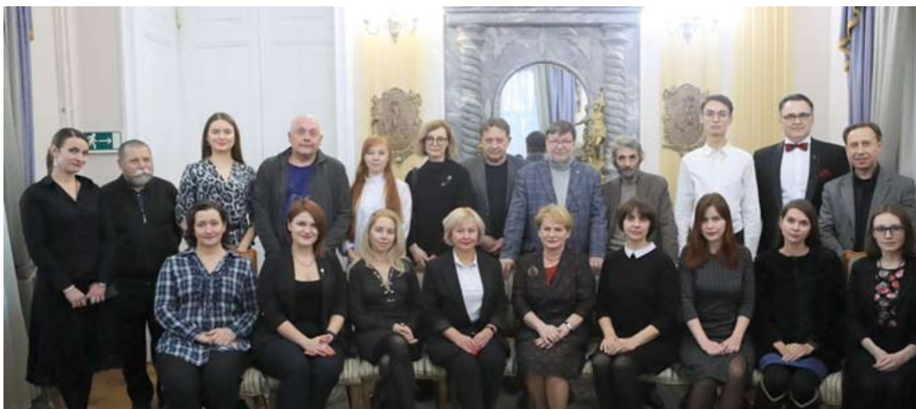
Участники церемонии вручения стипендий