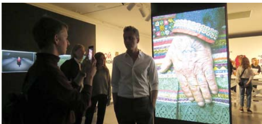
Урал-мари. «Смерти нет»