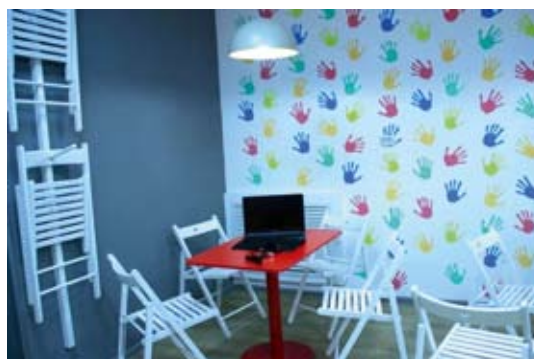
Модельная библиотека в Пышме

«Открытие модельной библиотеки является значимым событием для жителей Пышминского городского округа. Просто детская библиотека стала современным технически оснащенным информационным центром, популяризирующим книгу и чтение через новые технологии, новые форматы работы. Обновленная библиотека будет центром притяжения не только для детей, но всего населения, предоставит свои площадки для общения, отдыха, расширения