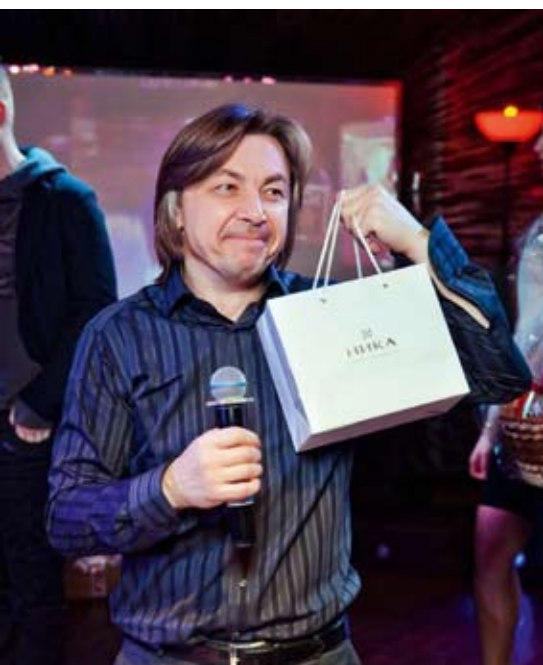
Премия – это приятно!