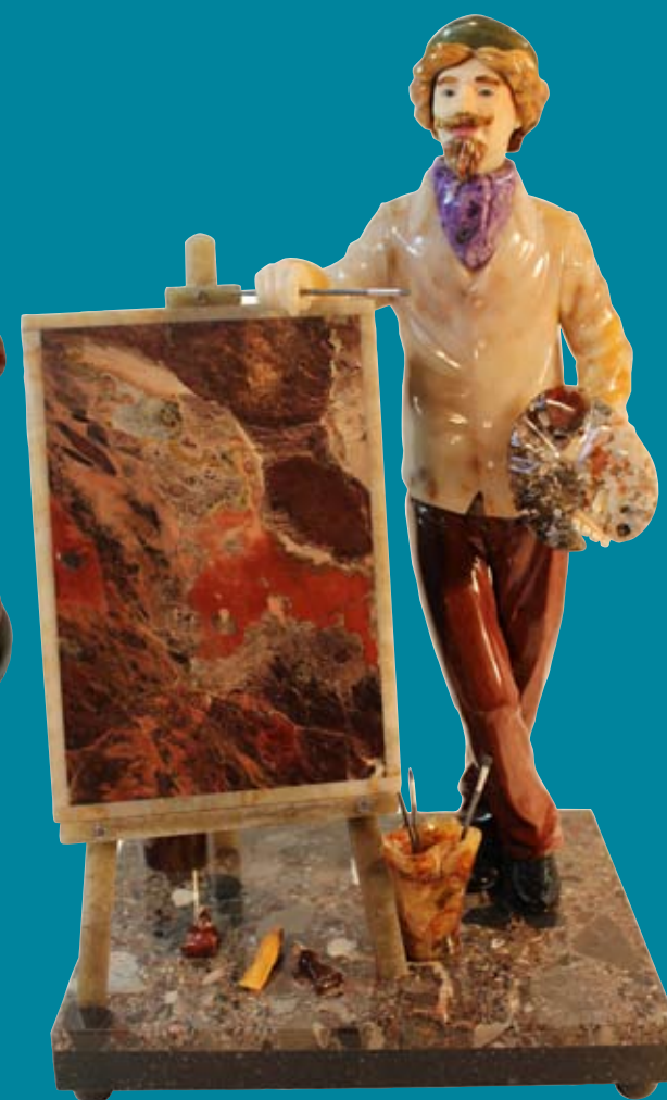
Работа И. Сергеева