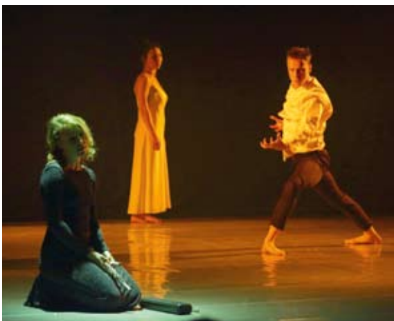
Танцевальная компания «Окоём» (Екатеринбург). «Я ЛЮБЛЮ (не тебя)». Премьера