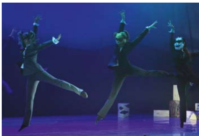
Театр балета «Шелкунчик» (Екатеринбург). «Петя и Волк». Preview