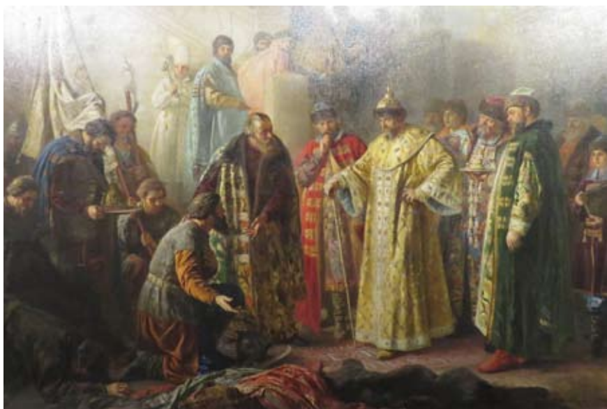
Восстановленная реставраторами ЕМИИ картина Станислава Растворовского

«Русские» залы обрели и новый цвет. Светлые стены словно расширяют пространство, и на их фоне в современной системе развески картины смотрятся особенно эффектно. Новые шторы дополняют строгий «академический» интерьер. Ничто не отвлекает от восприятия живописи. И все-таки мы «отвлечлись»,