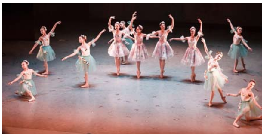
Ученицы лицея имени С.П. Дягилева

Первое отделение гала-концерта открылось перфомансом «Ускользящая красота», созданным преподавателями и студентами Уральского архитектурно-художественного университета. Действо представляло собой синтез различных видов искусства – анимации, графики, танцев, музыки, совмещенных с дефиле платьев начала XX века и костюмов к спектаклям Дягилевских сезонов. Во втором отделении выступа-