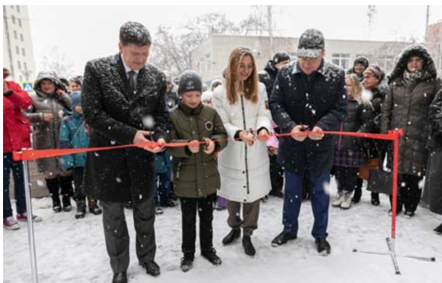
Открытие модельной библиотеки в Березовском

мастерская, информационный центр с журналами и газетами, арт-галерея, «книжный балкон». Многофункциональные зоны оснащены полиэкранами, персональными компьютерами, удобной современной мебелью, которая легко трансформируется в соответствии с форматом мероприятия и может создавать диалог-пространство, кинозал, место для интеллектуальных игр. Книжный фонд библиотеки пополнился более чем двумя тысячами экземпляров, большую часть которых составляют издания отечественной, зарубежной классики и современная популярная художественная литература, книги-лауреаты литературных премий. Читателям будет предлагаться более 50 наименований журналов и газет. Персонал библиотеки прошел обучение новым технологиям, чтобы включить в сферу своей деятельности как можно больше партнеров, организовать работу студий, мастер-классов, лекториев, клубов по интересам. На создание модельной муниципальной