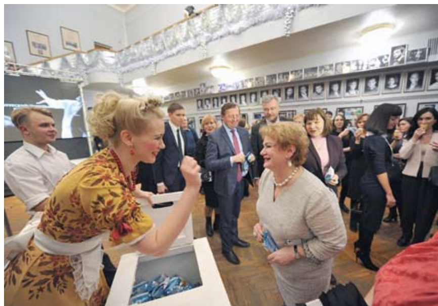
Открытие Года театра. В стилизованном «Парке культуры» в фойе Свердловской музыкальной комедии артисты... угощали мороженым. Министр решила попробовать

звук, чтобы коллектив начал новый виток своего развития с новыми техническими возможностями. Мы считаем, что годом календарным время театра не заканчивается. Поэтому сразу рассчитали, что да, «официальный» год прошел, но у нас еще обязательства по ремонту Дома актера, который непременно будет сделан (просто очень долго оформляются документы, но финансирование нам подтверждено). Будущей весной приступим