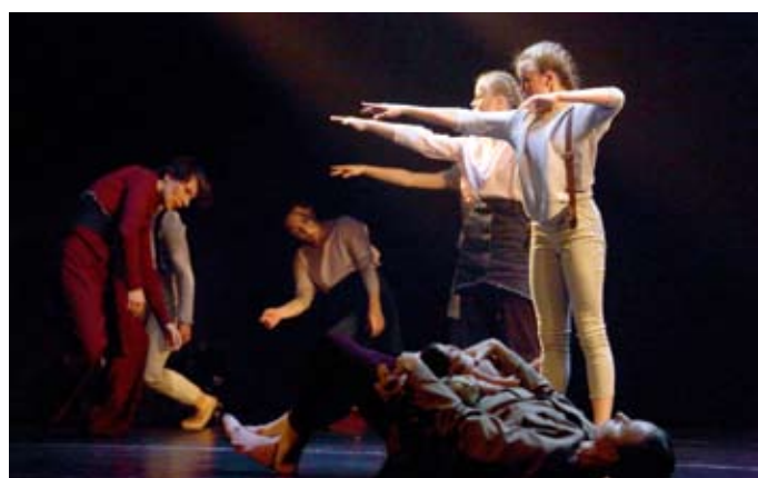
Танцевальный театр «Фора» (Екатеринбург). «Жизни»

немного потусторонние... Здесь же я впервые увидела танцовщиков ТанцТеатра не просто как людей, исполняющих красивые бессюжетные танцы в гармонии с музыкой, а как личностей — каждого. Не зря этот спектакль номинирован на «Золотую Маску».