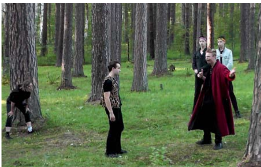
Сцена из ландшафтного спектакля «Рони, дочь разбойника»

то воплотить. Не осталась в стороне и важная тема «Взаимоотношения с родителями». Покопались в том, как родители воздействуют на наши желания, помогают и мешают, как больно, когда близкие не понимают и не разделяют твои взгляды. Ребята взяли за основу трагическую ситуацию реальной девочки и создали маленькую пьесу на основе интервью. Они вышли за рамки изначального замысла и сделали эмоционально и тактически очень сильную постановку. Кроме того, давалось задание на работу с эмоциями, для которого мы так и не нашли правильной формулировки. Имеет ли право человек выразить себя как хо-