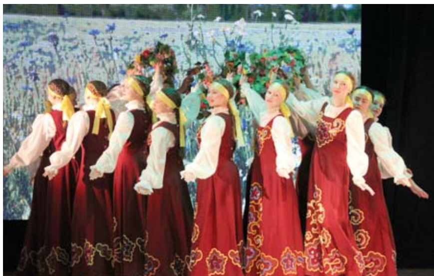
Народный танцевальный коллектив «Молодость»

– Дело в том, что наше учреждение было передано на баланс муниципалитета, а именно так назывался наш город изначально – Надеждинск. По-моему, очень красиво звучит!