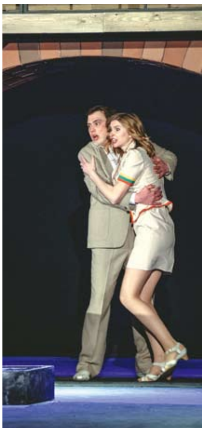
Галя («Все начинается с любви»)