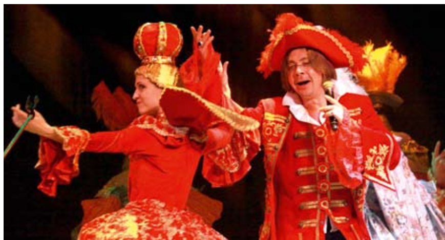
В главной партии рок-оперы «Парфюмер»

разных сторон, показать палитру красок и при этом раскрыть суть образа. Хотя, конечно, мюзикл — это, все-таки, шоу.