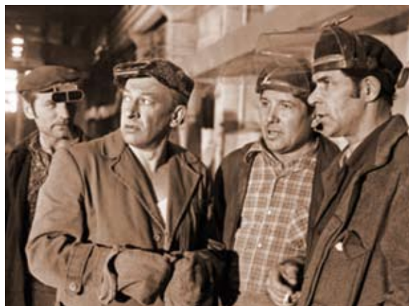
Во время работы над спектаклем «Сталевары» актеры МХАТ пришли на экскурсию на завод «Серп и молот», в центре — Евгений Евстигнеев

— Как вы оцениваете многочисленные отечественные сериалы на криминальные темы?