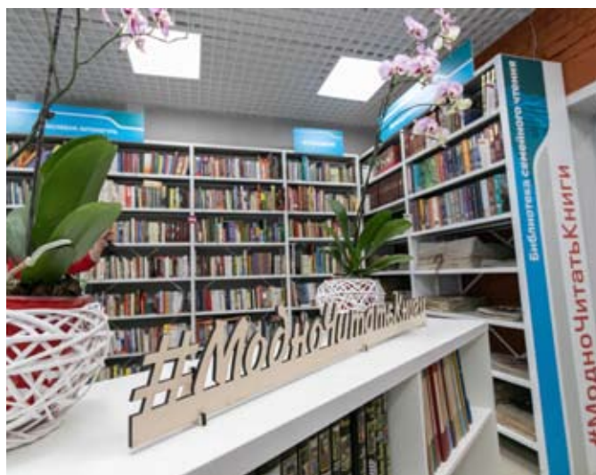
Модельная библиотека в Березовском

в конкурсном отборе на 2021 год для того, чтобы создать еще одну модельную библиотеку.