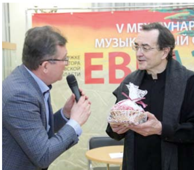
Пианист Пьер-Лоран ЭМАР (Франция) на церемонии «Черемуховый пирожок»

как космос, в числе прочего, предполагает и своеобразные полеты философии. Я решился на эту визуальную абстракцию, потому что она подталкивает зрителя к размышлениям, дает новый опыт восприятия музыки.