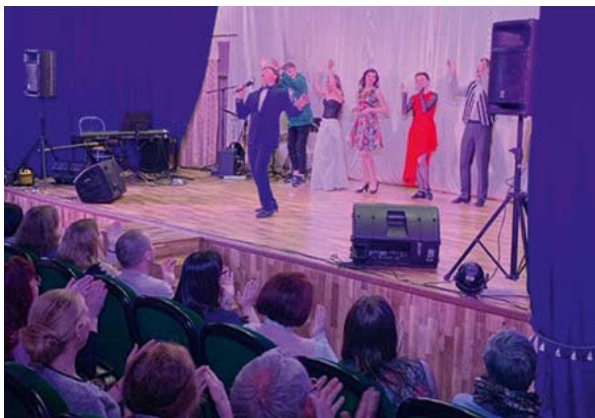
Гастроль Свердловского театра музыкальной комедии. Концерт в Ивделе

Еще о материальном. Нынче мы отремонтировали мастерские Новоуральского театра кукол «Сказ», и освобождение площадей в самом театре, где они сегодня находятся, позволяет удобнее разместить артистов и других творческих работников, создает комфортные