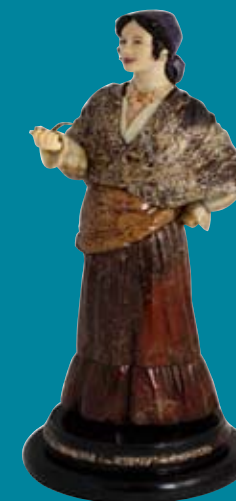
И. Сергеев. «Рада»