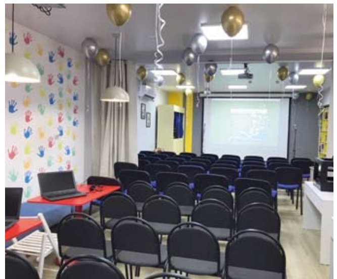
Зал пышминской библиотеки

библиотеки из федерального бюджета было выделено пять миллионов рублей.