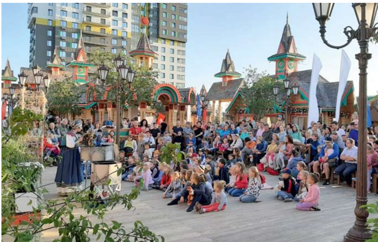
Спектакль «Аленький цветочек» в Москве в рамках фестиваля «Золотая Маска» в городе». Август 2019 года