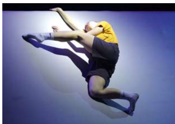
Гуманитарный университет (Екатеринбург). Программа миниатюр