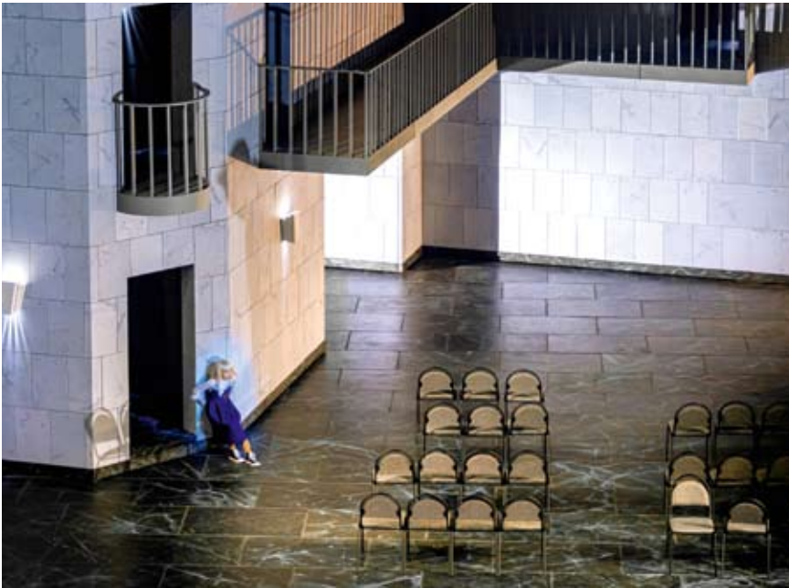
Сцена из оперы «Риголетто»