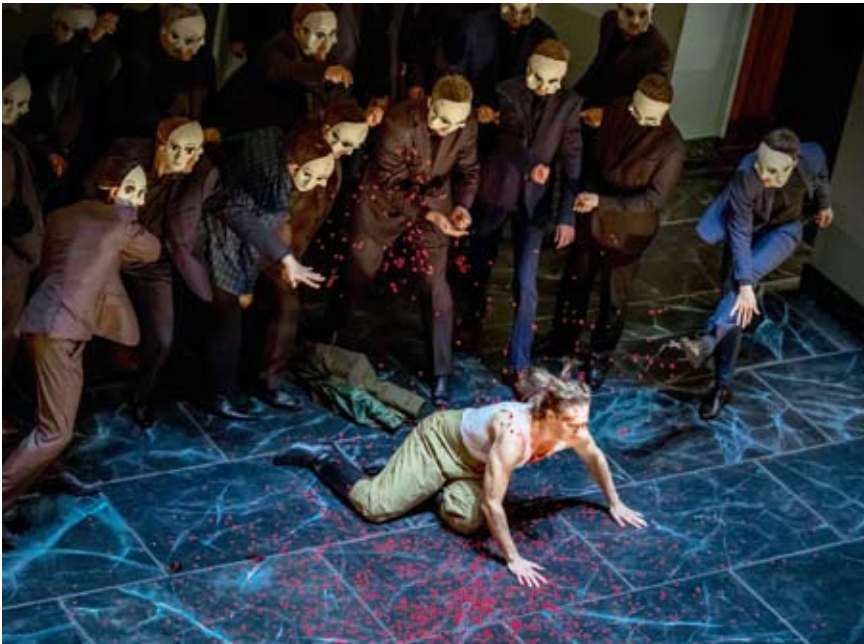
Сцена из оперы «Риголетто»