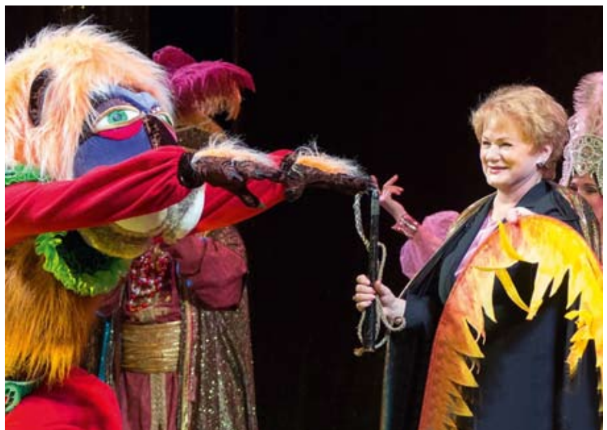
На фестивале театральных капутников «Золотая кочерыжка» в Нижнем Тагиле

– Это, конечно, очень важно. Театральный институт проводит собственный фестиваль моноспектаклей «Он, она, они», на который откликаются не только студенты творческих вузов, но