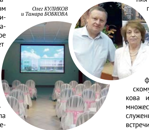
Зал виртуальных концертов в ДК «Современник»