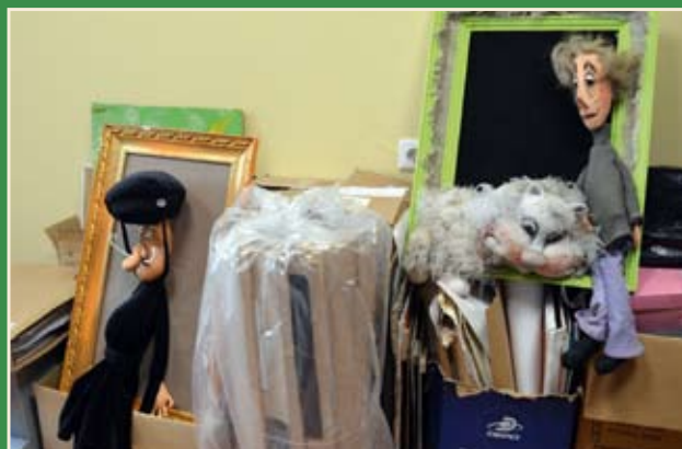
Кукольное население мастерских