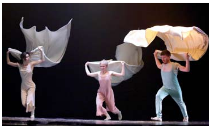
Танцпроект «Choreo Production Center» (Екатеринбург). «Когда Я родился». Премьера. Первый показ