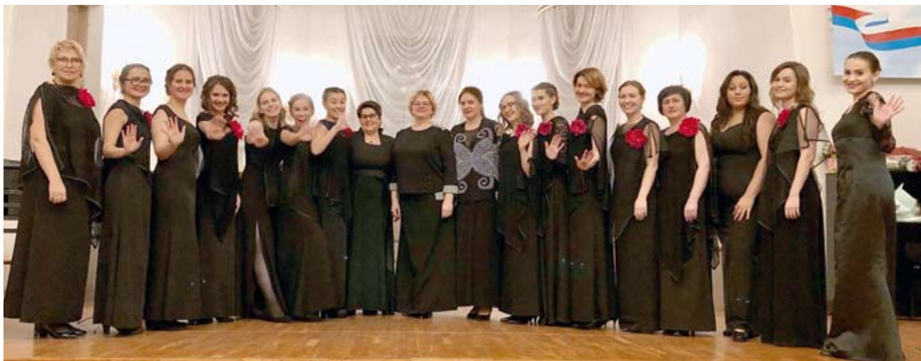
После праздничного концерта