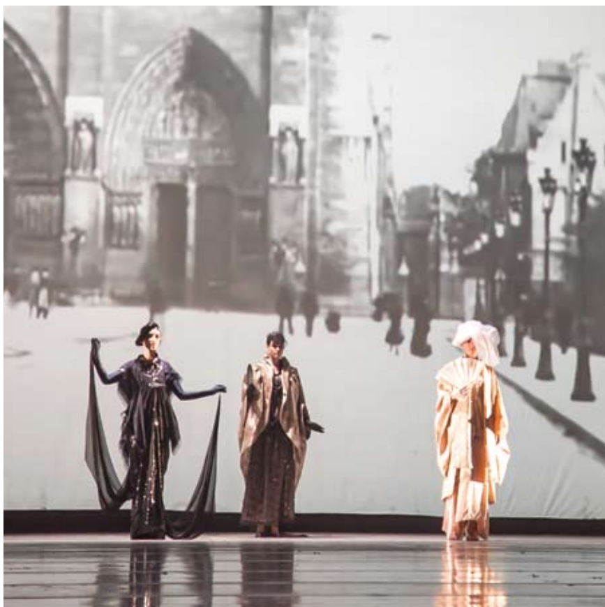
Перформанс «Ускользящая красота» УрГАХУ

Открылся фестиваль выставкой художественных работ и арт-объектов «По следам Серебряного века...» в Уральском центре развития дизайна. Первая часть экспозиции состояла из работ учащих лица имени С.П. Дягилева, посвященных как самому деятелю культуры, так и основной теме «Русских сезонов» — балету. Вторая часть выставки была представлена работами студентов и преподавателей Уральского государственного архитектурно-художественного университета.