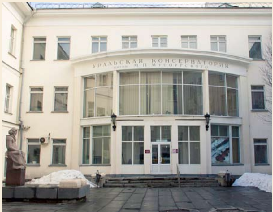
Уральская консерватория имени М.П. Мусоргского и памятник композитору

Всегда стоим за то, чтобы пробовать новое. Например, современная нотация. Запись сов-