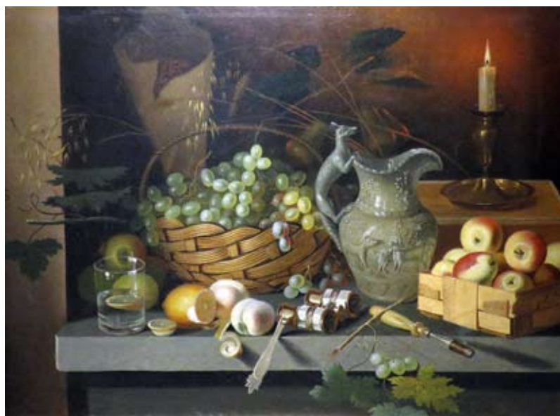
«Плоды и свеча» — натюрморт Ивана Хруцкого (1850)