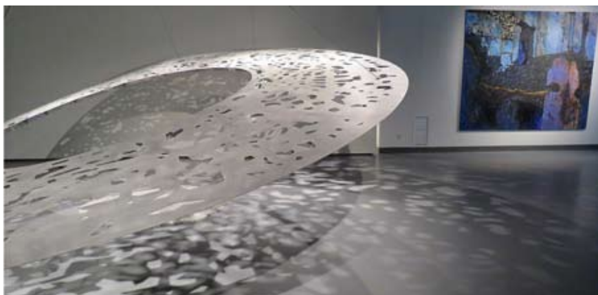
В Арт-галерее «Синара»