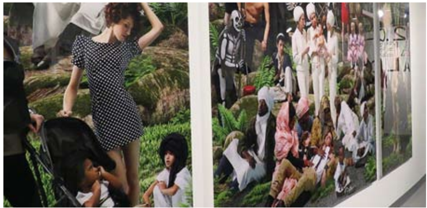
Ельцин Центр представил спецпроект группы AES+F