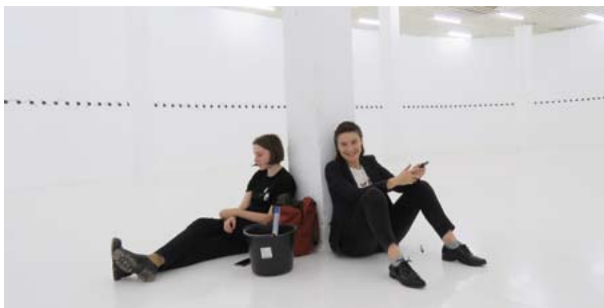
В окружении времени