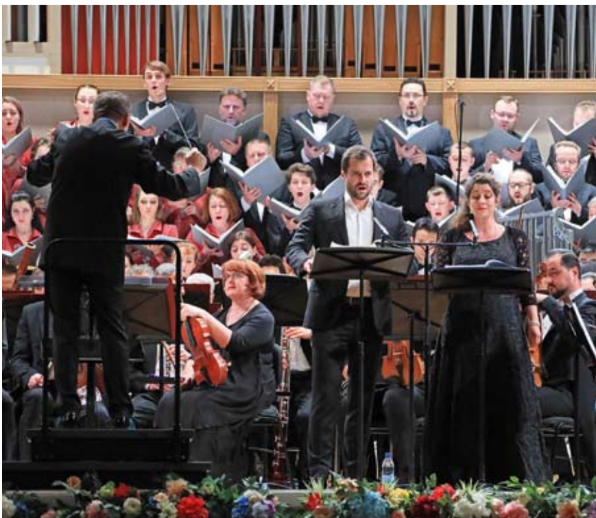
Открытие фестиваля «Евразия»

Почти 400 музыкантов и руководителей крупнейших концертных залов Европы и Азии, представляющих 13 стран мира, более пяти тысяч слушателей в зале и многотысячная аудитория прямых трансляций на протяжении восьми дней были «Евразией» – крупнейшим международным музыкальным фестивалем, который в пятый раз проходил в Екатеринбурге –