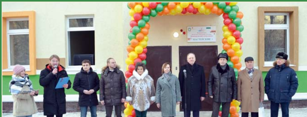
Торжественное открытие театральных мастерских театра кукол «Сказ»

В Новоуральском театре кукол состоялось торжественное открытие здания театральных мастерских, в котором в рамках реализации национального проекта «Культура» был выполнен капитальный ремонт. Теперь в театре обеспечено производство полного цикла: все, что зрители видят на сцене, полностью изготавливается в мастерских. Здесь расположены столярный и художественный цеха, покрасочная, прачечная, склады кукол и костюмов, материальных ценностей, цех для ремонта текущих спектаклей, студия звукозаписи, репетиционный зал и административные кабинеты. На проведение работ из федерального, областного, муниципального бюджетов было выделено 24,6 миллиона рублей.