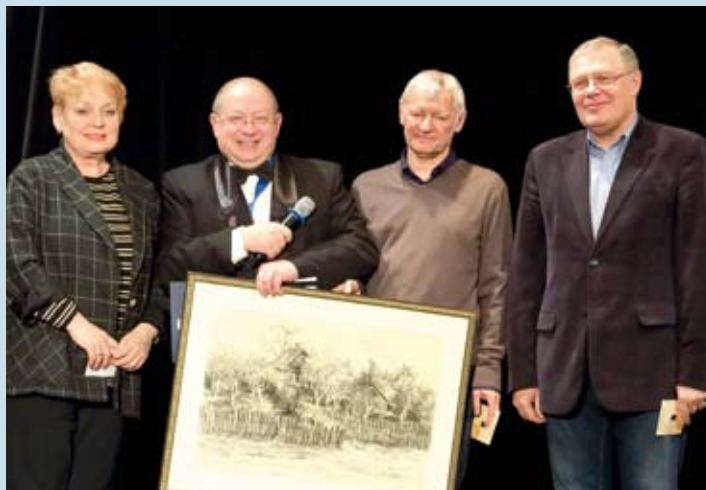
Поздравление и подарок от братских творческих союзов — СТД, художников и писателей

Камерный праздничный концерт избранных произведений наших композиторов пройдет в пространстве «Живого театра». А самое важное событие — иммерсивный концерт в екатеринбургском Доме актера. На нескольких площадках одновременно здесь представят свои произ-