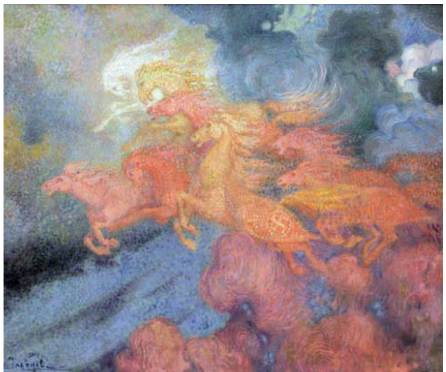
Всеволод Ульянов. «Красные кони» (1917)