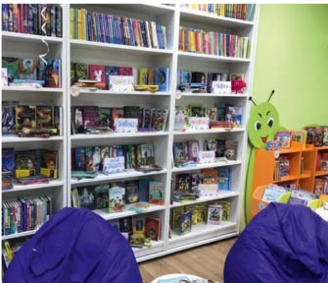
В обновленной библиотеке Пышмы — комфортно