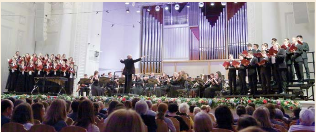
Оркестр духовых инструментов и смешанный хор студентов УГК