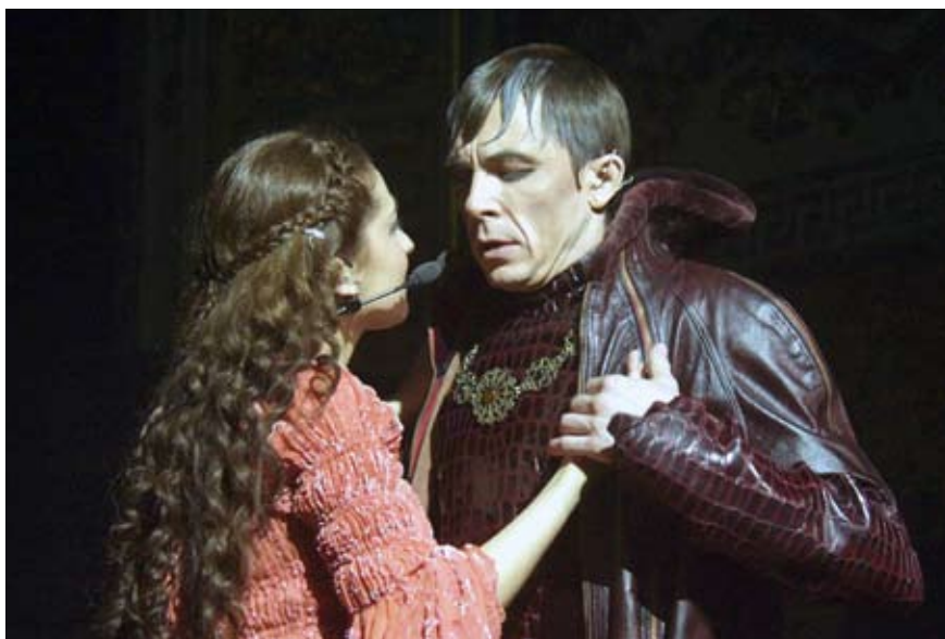
В мюзикле «Ромео и Джульетта»

— Ближе сам процесс работы, в драме ли, в мюзикле, на сцене или съемочной площадке. Когда погружаешься в него и с этим —