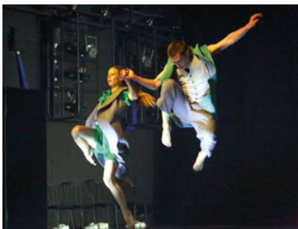
ТанцТеатр (Екатеринбург). «Шопен. Carte blanche». Премьера