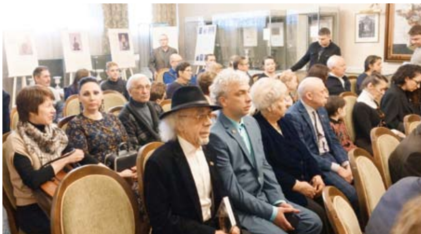
В зале династии ювелиров

«...И вот пошли. Она впереди, Степан за ней. Куда она идет – все ей открыто. Как комнаты большие под землей стали, а стены у них разные. То все зеленые, то желтые с золотыми крапинками. На которых опять цветы медные. Синие тоже есть, лазоревые. Одним словом, изукрашено, что и сказать нельзя...» – помните эти бажовские слова?