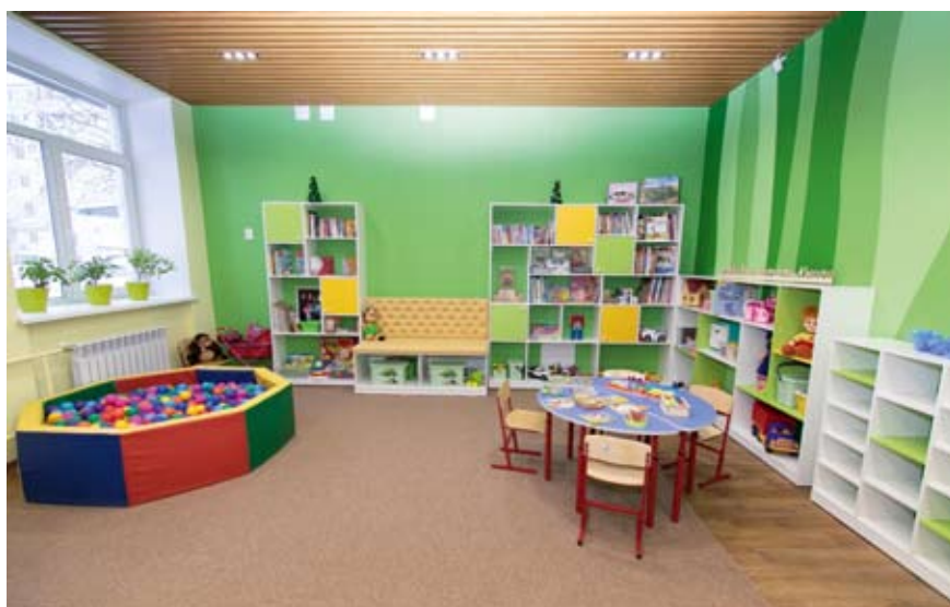
Для маленьких читателей Березовского