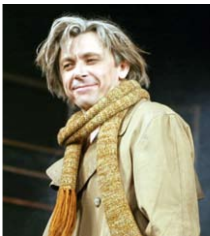
В роли Мастера («Мастер и Маргарита»)

– Важно все, важен отклик. И, конечно, для меня важно мнение профессионалов. Важно