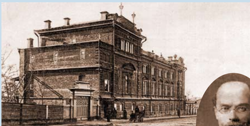
Концертный зал Маклецкого. Екатеринбург. XIX век

В 1912-м году у нас были открыты музыкальные классы –