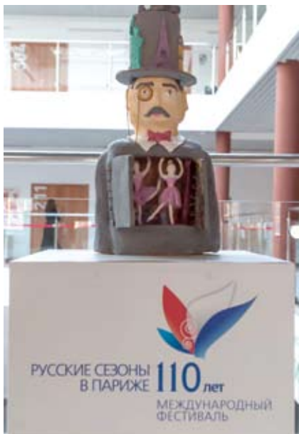
Из работ учащихся лицея имени С.П. Дягилева

В рамках гала-концерта состоялось вручение премии общественного признания «СПАСИБО», учрежденной председателем регионального совета «Всероссийского совета