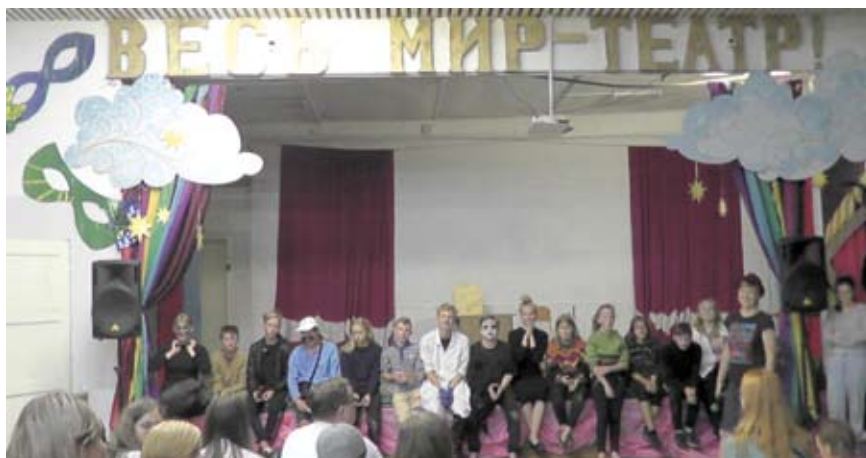
Обсуждение эскизов драматических отрывков

О.М. — Наш форум — колоссальный скачок в театральном образовании, в личностном и творческом развитии детей. Ру-