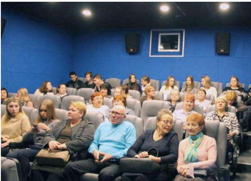
Первые зрители в кинозале