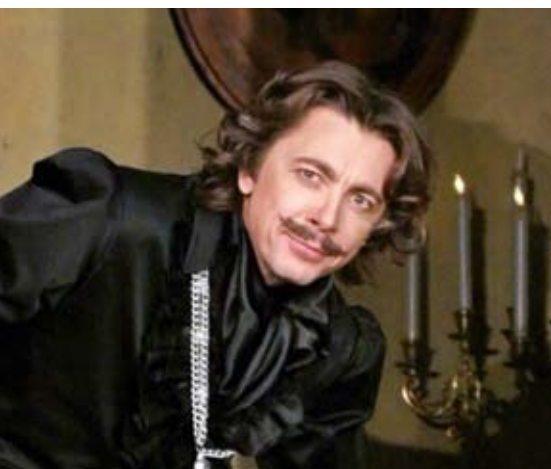
В мюзикле «Обыкновенное чудо»