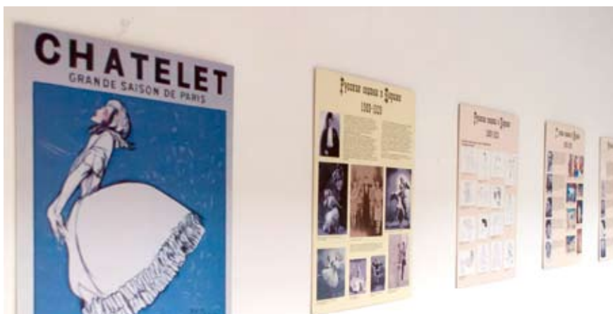
Работы студентов УрГАХУ

ли учащиеся старших классов хореографического отделения лицея имени Дягилева, которые исполнили как классические балетные постановки, так и современные. Артисты театра Урал Опера Балет, в числе которых есть и выпускники лицея, выступили с сольными номерами. Гала-концерт завершился одноактным балетом Brahms party в исполнении танцовщиков театра.