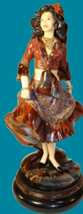
И. Сергеев. «Пламя»