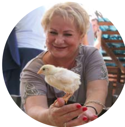
«Актеры – как птицы...»

– Церемония открытия Театрального марафона, который мы принимали. Эта «эстафета» настолько объединила сообщество театральное! Все вместе занимались подготовкой, принимали гостей, обеспечивали, чтобы у нас были представлены театры Уральского федерального округа, и как это все на площадке перед театром музкомедии готовилось, как спектакль! В церемонии передачи символов Года задействованы были все городские театры, вне зависимости от того, частный он, муниципальный, областной, федеральный –