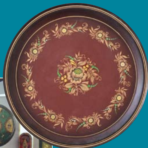
С. Веселков. Поднос