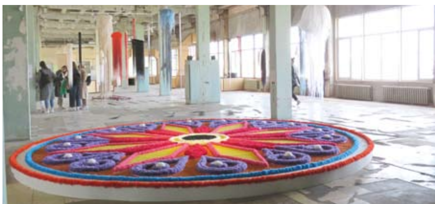
Карта-цветок живых и мертвых