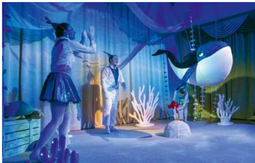
Театр кукол. Премьера бэби-спектакля «Люющий кит. Подводные истории»

Востоке, участвовать в престижных конкурсах и обойти массу соперников. Спектакль «Господа Головлевы. Маменька», поставленный режиссером Даниилом Безносковым, включен в лонг-лист главной театральной премии России «Золотая Маска». Из 800 спектаклей муниципальных театров страны экспертное жюри столь высоко оценило 100, впервые