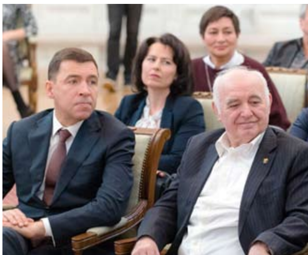
Губернатор области Евгений КУЙВАШЕВ и директор Свердловской филармонии Александр КОЛОТУРСКИЙ

Согласно концепции британского архитектурного бюро Zaha Hadid Architects, в Екатеринбурге появится не имеющий аналогов комплекс. Он будет состоять из четырех залов: два сохранят в историческом здании, еще два акустических зала общей вместимостью до двух тысяч мест построят рядом. Предполагается, что и залы, и фойе для зрителей, и парадная площадь перед филармонией, и преобразованный сад Вайнера будут пространственно взаимосвязаны. Основной новый зал предстанет в форме виноградника с креслами, окружающими сцену. Этот подход к организации про-