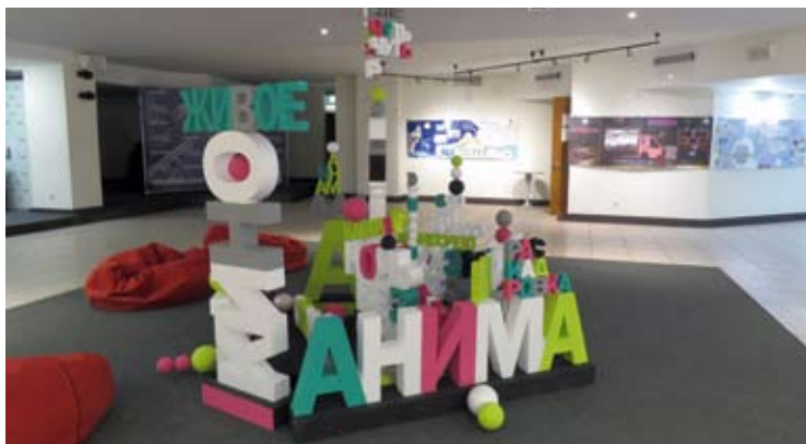
Анимационный интерьер «Кинопробы»

отнюдь не рисованные анекдотики, а результат умения студентов представить любые вещи, даже самые прозаические, образно. Некоторые студенческие фильмы, в свою очередь, трудно представить учебными — так они точны и тонки. Например, «Гавел. О свободе» или «Здравствуйте, родные!». Во время фестиваля состоялся также анимационный питчинг, где авторитетные профессионалы выбирали из представленных студентами проектов достойный стать фильмом. Победила екатеринбурженка —