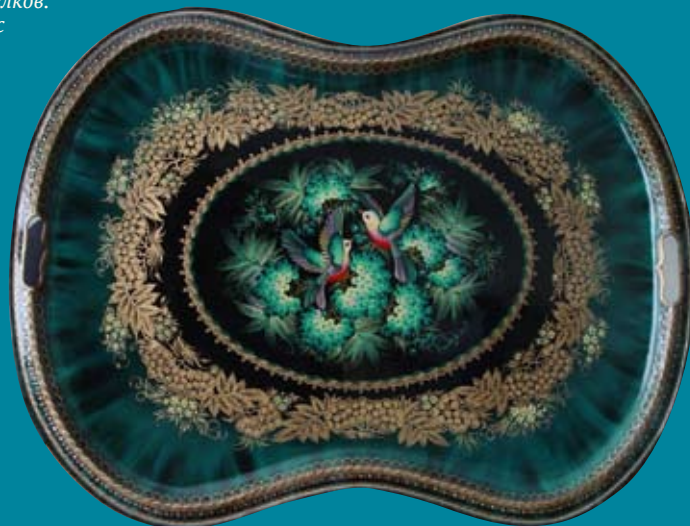
Т. Бинас. Поднос