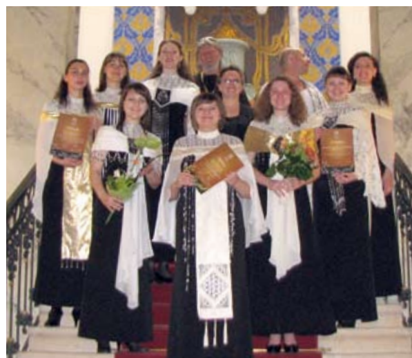
«Fresco» хороши в любом интерьере