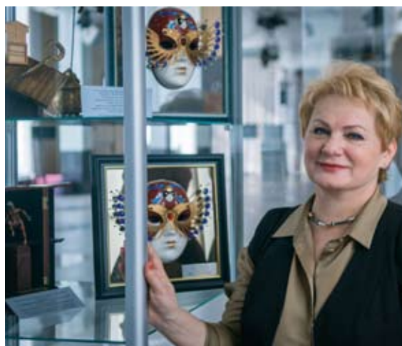
Маски, которые всегда нам дороги

— Да, по-честному, и поэтому, когда у нас получают одни театры и не получают другие, я всегда говорю о том, что не принимаю единолично решение. Тайное голосование! Я член комиссии,