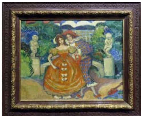
«Маскарад» Сергея Судейкина (1910-е годы)