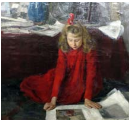
Наталья Витберг. «Девочка, рассматривающая картинки» (1900—1910)

Несколько месяцев шла работа музейщиков по «перезагрузке» экспозиции. Это, конечно же, не последнее обновление. Минуют еще несколько лет, и... Стремление к совершенствованию в ЕМИИ не менее постоянно, чем его постоянные экспозиции, и партнеры, влюбленные в искусство, готовы помочь музею.