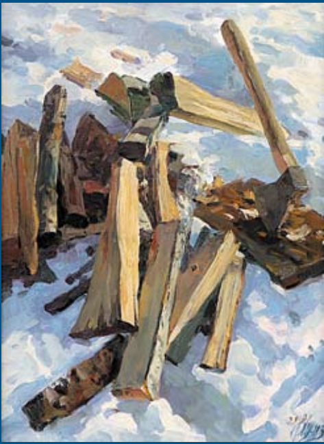
Р. Хузин. «Дрова». Холст, масло. 2010