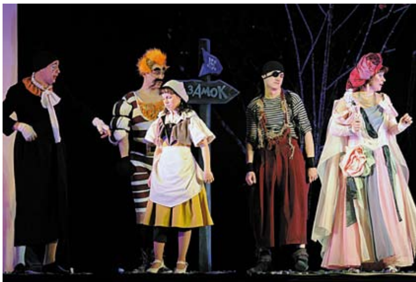
Клоуны — помощники усердные, но неуклюжие

Новая постановка уже не «золушка» в тюзовском репертуаре. Проверка «горошиной» гостеприимной, но чужой сцены пройдена. В недалеком будущем ее ожидает испытание собственной сценой. Такие волшебные комедии ставят не на один «бездомный» сезон. Премьере, когда уже выйдет из премьерного возраста, предстоит подтвердить, что она — «настоящая принцесса».