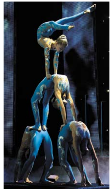
Гуттаперчевые гимнастки из Нижнего Тагила