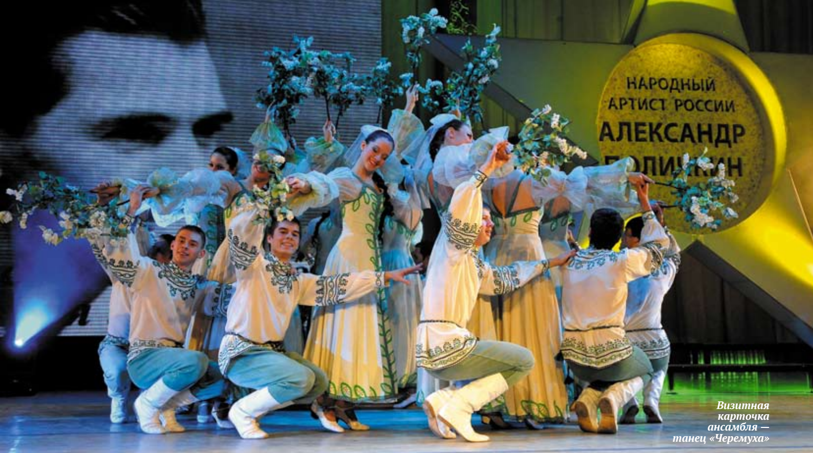
Визитная карточка ансамбля — танец «Черемуха»

идею и замысел. Научусь ли я этому?.. Смотрю на постановки Поличкина, а там движение как будто само рождается... Простые шаги танца, а как все точно, как лаконично.