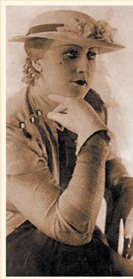
Ютта — Мария ВИКС («Голландочка»)

Всего несколько фотографий... Как красивы эти лица... Неотъемлемый зримый фрагмент замечательной истории замечательного театра.