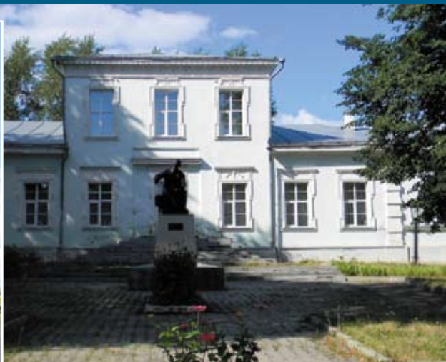
Дом-музей П.И. Чайковского