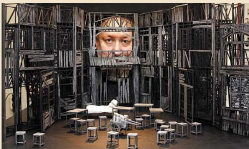
Макет декораций к спектаклю «Скрипач на крыше»