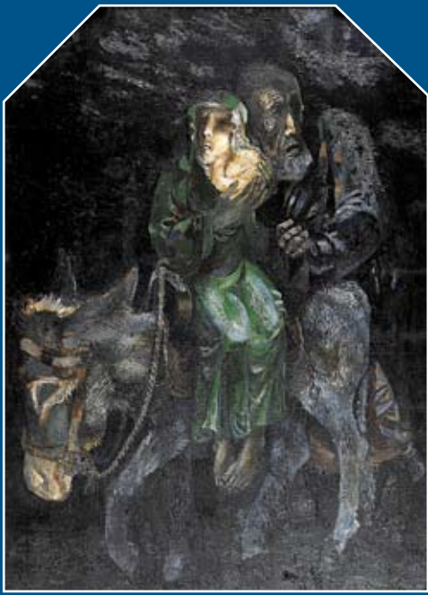
«Бегство». Холст, масло