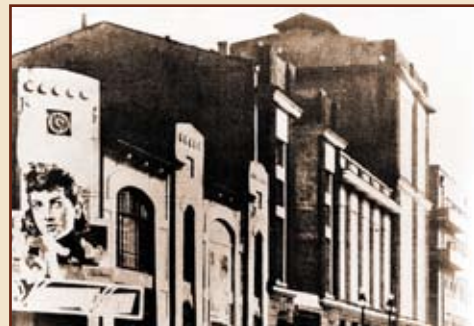
Первый «дом» музкомедии – здание Делового клуба

В конце 20-х – начале 30-х годов прошлого века в России вновь появились состоятельные люди, жаждавшие развлечений. На этой волне жанр оперетты стал чрезвычайно популярным и наконец-то получил государственную прописку на сценических площадках. Свое кафешантанное и водевильное прошлое оперетте предстояло искупить отказом от буржуазно-игривой направленности в пользу советского репертуара, с новыми героями и новым содержанием. Один за другим в стране открываются театры «легкого» жанра. Первый – в 1926 году в Хабаровске, затем Московский театр оперетты, Ленинградский и четвертый – Свердловский театр музыкальной комедии.