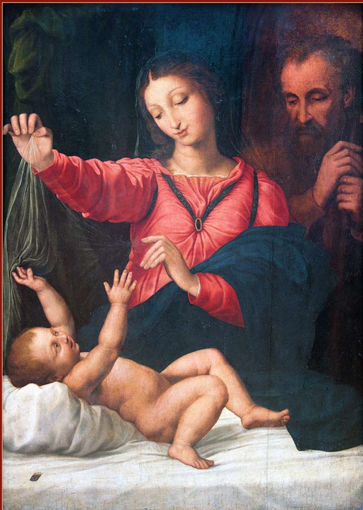
После реставрации картина Рафаэля Санти, которую называют «Тагильской Мадонной» (см. стр. 72), долгое время принадлежала Государственному музею изобразительных искусств имени А.С. Пушкина, затем Свердловской картинной галерее. В 1978 году «Святое семейство» было передано Нижнетагильскому музею изобразительных искусств.