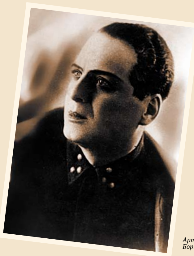
Артист Борис КОРИНТЕЛИ