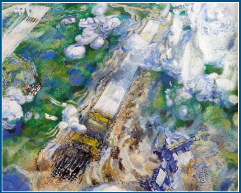
«Новая взлетно-посадочная полоса». Диптих

действий, ставших чудовищно привычными и будничными. «Сглаживает» тяготы времени лишь мягкий, лирический пейзаж, где тихо падающие хлопья снега, деревья, реки и поля становятся молчаливыми свидетелями человеческой драмы.