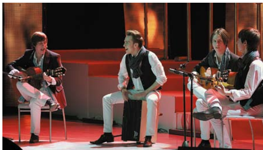
Ансамбль «Терра Фламенко» — новое имя на эстраде