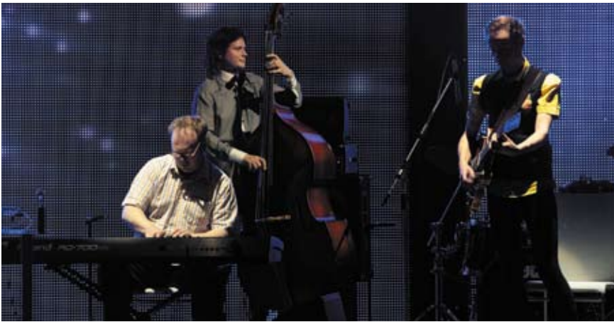
Презентация нового арт-проекта «Трио Гурчика»