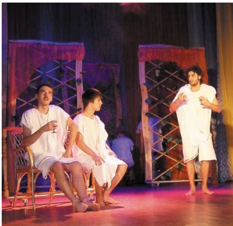
Сцена из спектакля «Ханума».

От поколения к поколению, от учителей к ученикам передаются традиции коллектива, его дух. В этом — залог жизни и молодости детского театра имени Леонида Диковского.