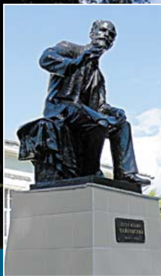
Памятник П.И. Чайковскому

По всему миру фестивали часто зарождаются в маленьких городах, становясь их неотъемлемой частью, меняя их жизнь и облик, становятся реальным стимулом для инвестиций, развития инфраструктуры, не говоря о том, что способствуют совершенствованию местных музыкальных сил и вкусов. Теперь такая амбициозная идея нашла свое воплощение и на Урале.