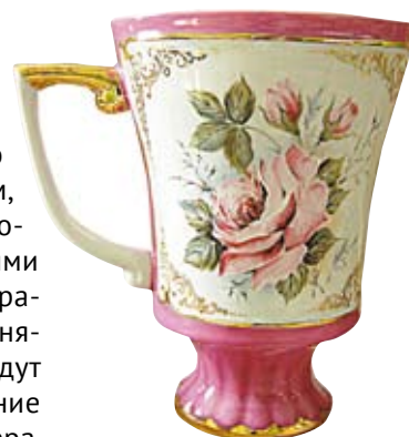
Сысертский фарфор. Бокал «Колокол»

В марте правительство Свердловской области приняло постановление, направленное на поддержку народных промыслов. В нем утверждён перечень мест их традиционного бытования.