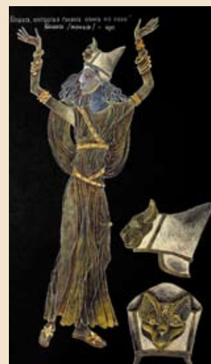
Эскиз костюма к спектаклю «Кошки»