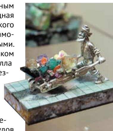
М.В. Зуевич. «Уральский старатель». Полудрагоценные и подделочные камни