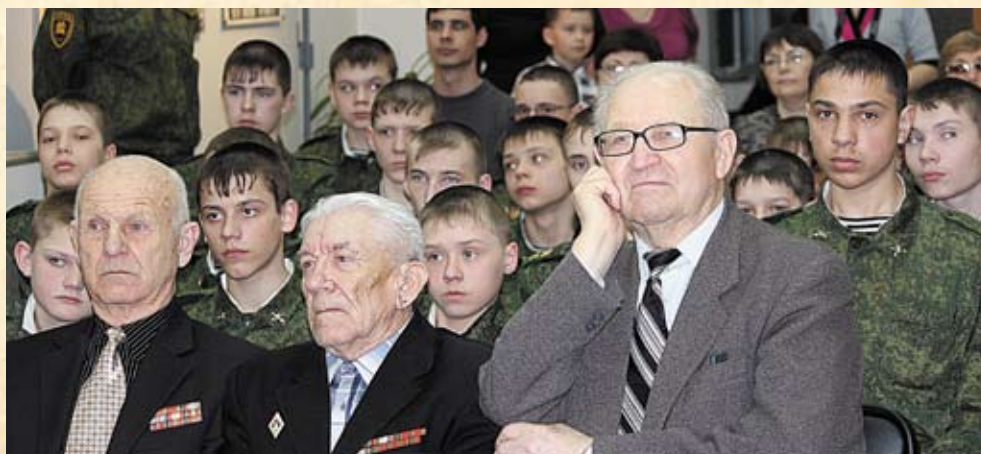
Ветераны и кадеты на открытии выставки