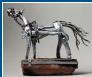
«Лошадка». Металл, холодная ковка

Недавнее историческое прошлое также глубоко волнует художника. Для Метелева, чье детство пришлось на тяжелые военные и послевоенные годы, «война — это, прежде всего, война в тылу, усталость, голод, безграничное терпение окружающих людей». «Сорок первый год» (1966—1973), «Битва за Родину» (1975) предельно обнажают бессмысленность и противоестественную человеческой природе сущность войны. В каждой из этих работ художник ищет свои выразительные средства, по-своему интерпретируя опыт «сурового стиля». Цикл «Гражданская война» (1980-е) открывает оборотную сторону военных