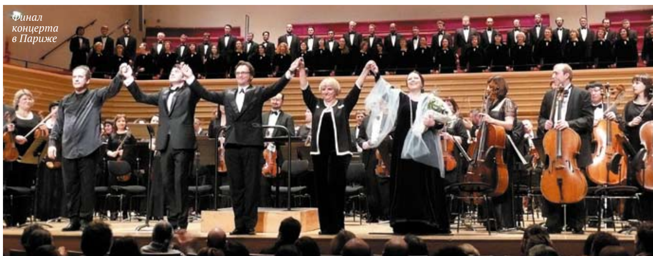
Финал концерта в Париже